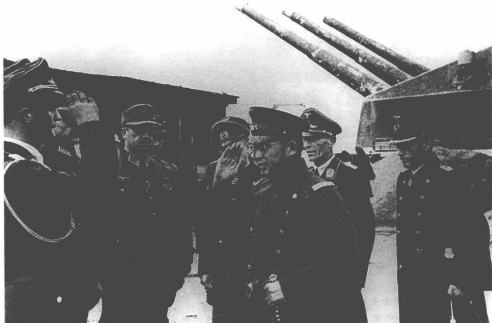
访问德军要塞的小野寺信

2月中旬,日本陆军参谋本部接到一份密电,发信人是驻欧洲情报军官小野寺信少将,密电内容很惊人:苏联已答应美国将向日本开战,宣战时机,据信是在对德战争胜利3个月后。显然,这正是“雅尔塔密约”的内容。可是,据说