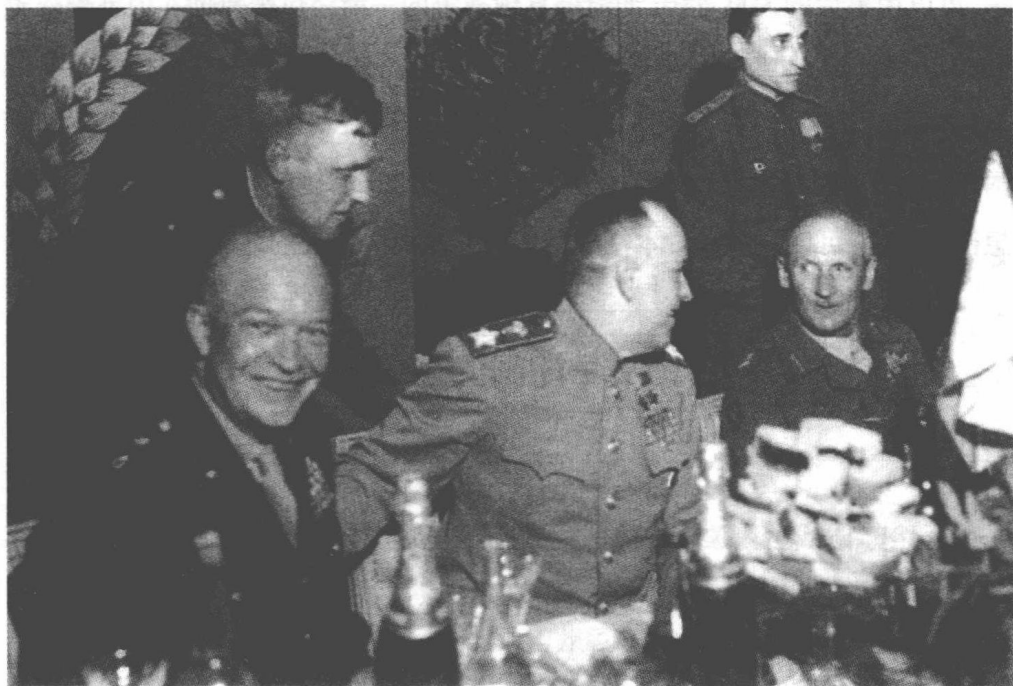
欧洲战争结束后,朱可夫在柏林设宴招待艾森豪威尔和蒙哥马利

在远东扩张势力范围,无疑是苏联和斯大林全球战略的重要一环,已有长期的布局。从内部因素考虑,虽然斯大林赢得了对德国的战争,可也耗尽了苏联国力,付出了无比惨烈的巨大代价。而斯大林在战争初期所犯的错误,也不是所有人都能轻易忘记的。为此,斯大林也需要用“代价较小”的扩张,来巩固他自己在国内的威信。而罗斯福邀请俄国人所进行的战役,不仅将使苏联夺取“满洲”、朝鲜北部、库页岛等地,甚至可以进而确立其在整个远东的战略优