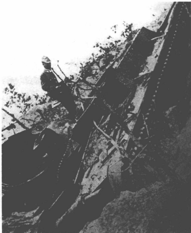
张鼓峰冲突中被击毁的苏军T-26坦克

西方战争史学家宣称,苏德战争爆发后,苏联为了应对德国的闪电攻势,几乎抽空了远东部队,用来救援欧洲战场。但这并不符合事实。