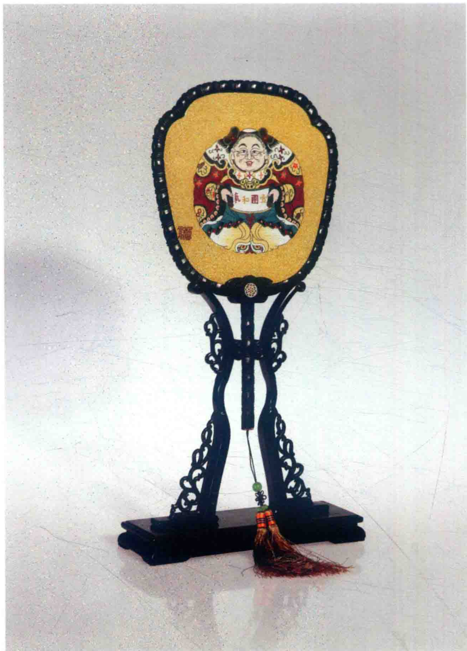
八 苏州工艺美院以桃花坞年画为元素设计开发的缙丝宫扇（2006年）