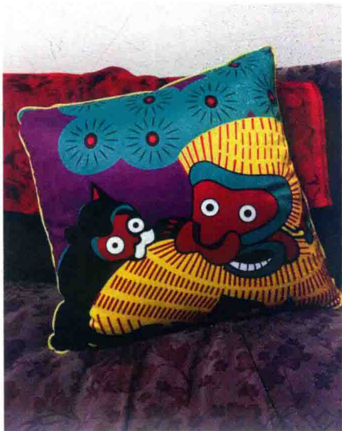
九 凤翔木版年画《辈辈封侯》古样复刻新印（1982年刻，2005年印） 一〇 以凤翔木版年画《辈辈封侯》为元素设计的抱枕（2016年）