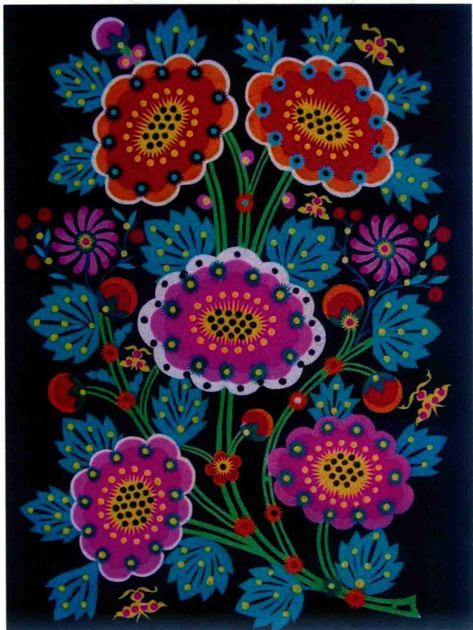
一 彩色剪贴纸《红花花 绿叶叶》(库淑兰设计制作, 20世纪90年代)