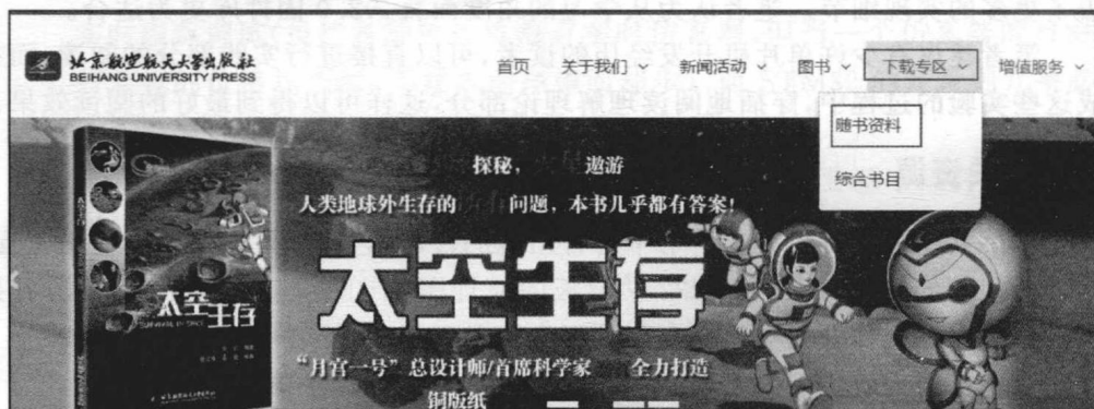
图 1 北航出版社网站首页

同时,不少读者反映不知道在哪里可以获取到本书配套程序资料,这里详细说明一下。本书的资料可在北京航空航天大学出版社官方网站上获取,具体获取的方式为:打开北航出版社主页: http://www.buaapress.com.cn 进入“下载专区→随书资料”(如图 1),在随书资料页的搜索框内输入“stm32 自学笔记”,单击“搜索”(如图 2)即可找到本书资料;无须注册,无须激活码,可任意下载。