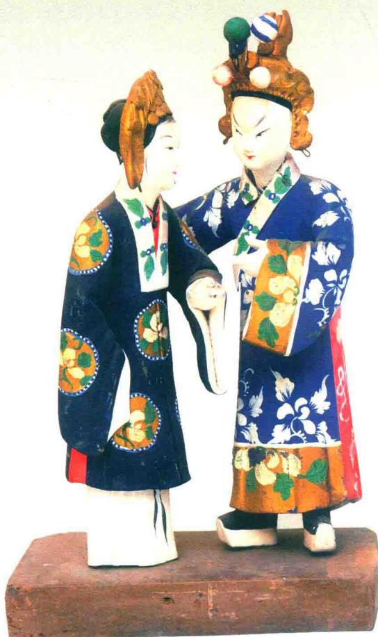
凤仪亭 (丁阿金)

彩塑，融凝外来艺术日臻创新成熟的隋代彩塑，以细腻完整的手法塑造了雍容丰润的唐代彩塑，还是以写实流畅手法表现人物内心情感、刻画人物性格和形象特征的宋代彩塑，以及求索于生活中人的形态与性格，富于典雅装饰之风的元、明、清彩塑，它们的创作时代与创作条件不尽相同，但所追求的艺术目标是一致的，即造型圆满完整、形态优美生动、色彩纯朴明快。