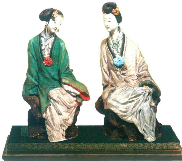
少女（张明山）©“泥人张”彩塑

泥彩塑的滥觞可以追溯到五六千年前的新石器时代，原始的先民在自己的劳动中逐渐将单一的物象复合化，显示了类型化的美，并把不同形象的物品经过加工琢磨变成相同的形象，显示同一性的美，于是他们对物象审美意识与意趣的思维闪光，影响并促成了中国民间泥彩塑艺术的形成。后来，秦汉以前作为“明器”使用的彩俑出现，使这种将古拙质朴的造型与彩绘结合的技巧成为了隋唐以后彩塑发展的基础。而隋唐彩塑又在新的外来艺术滋养中产生了新的变化，从朴素到精炼，从质朴到丰富，但又不失以前追求神韵的特点，同时在其艺术实践中又不断地提高和完善了造型与彩绘结合的技巧。