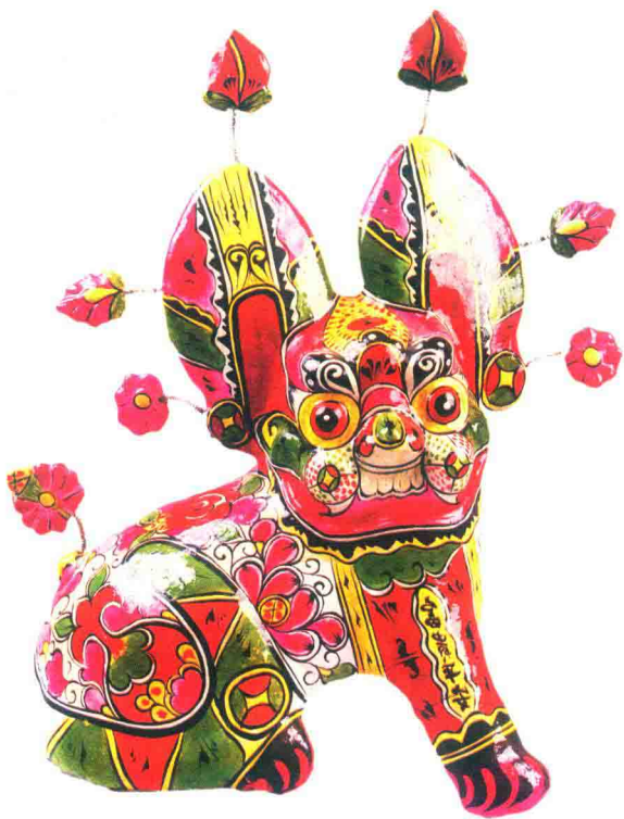
镇宅卧虎(胡永兴)

正是由于中国民间泥彩塑生发于华夏民族的文化土壤的根性，于是在其渐进变化中，它的创作理念、创作方法、工艺程序、审美标准和风格形态，都与中国传统文化一脉相承，也与其渐进中的历史环境息息相关。中国民间泥彩塑在各历史时期受当时社会政治、经济文化等诸多因素的影响，形成不同时期的艺术形式的差异性，这种差异性构成了各个时期民间泥彩塑艺术成因的地域性和风格的多样性，从而留下了中国民间泥彩塑有规律性的历史发展轨迹。这正如美国著名人类学家路易斯·亨利·摩尔根指出的：“我们感到幸运的是，人类进步的事件不依靠特殊的人物而能体现于有形的记录中，这种记录