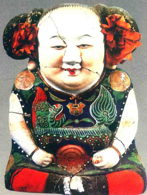
阿福 (清代) © 惠山泥彩塑