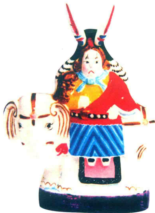
兔爷 (双起翔) © 北京泥彩塑