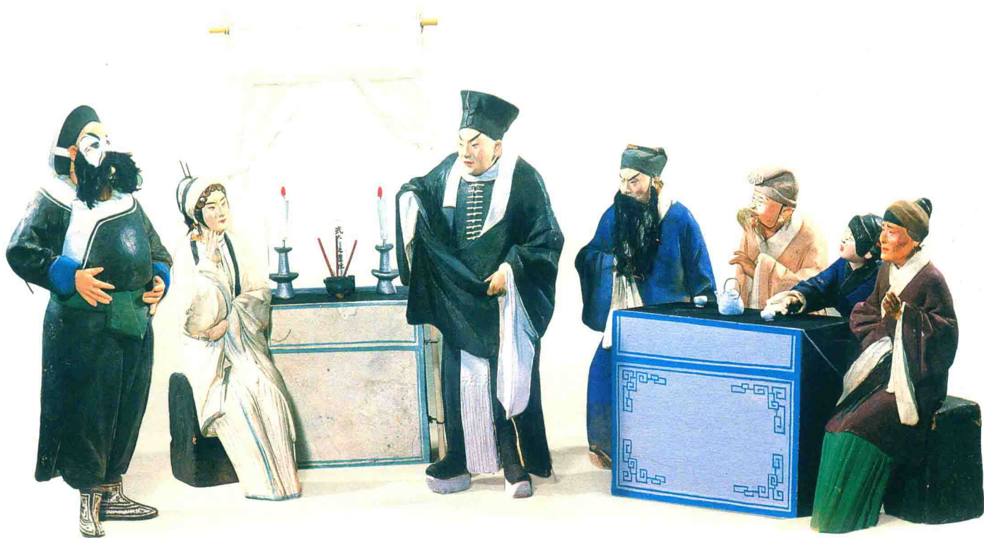
武松省亲（张玉亭）©“泥人张”彩塑

总之，无论是原始淳厚质朴的彩陶器物，粗犷古拙的男女奴隶俑，已形成飘逸超然之风的魏晋南北朝