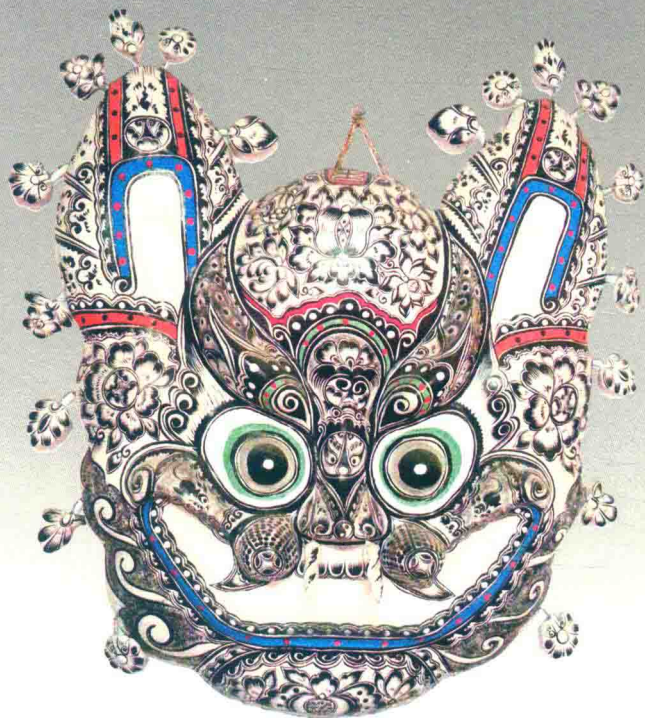
挂虎(胡深) © 凤翔泥彩塑

中国民间泥彩塑植根于中华文化沃土之中，它循系中华文化的优秀文脉，生发繁衍，逐渐形成数量众多、规模宏大、风格迥异的艺术形式。它是世世代代人民群众精神力量的体现，是高度智慧与卓越创作才能的结晶。