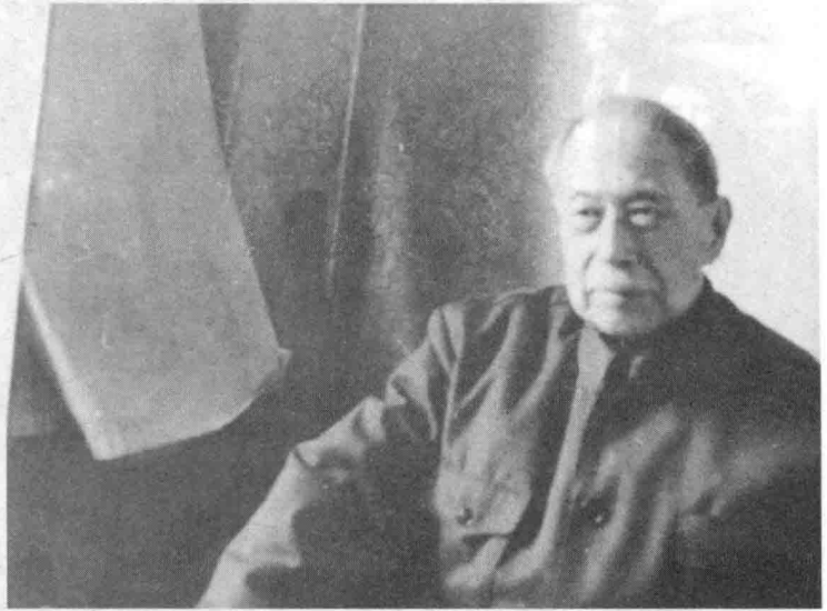
1984年4月到北京市中医院探望病中的恩师赵炳南教授