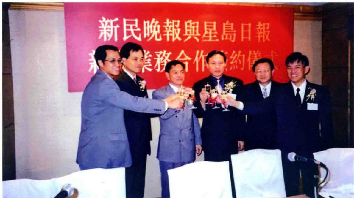
2002年10月18日新民晚报与香港星岛日报签订新闻业务合作协议