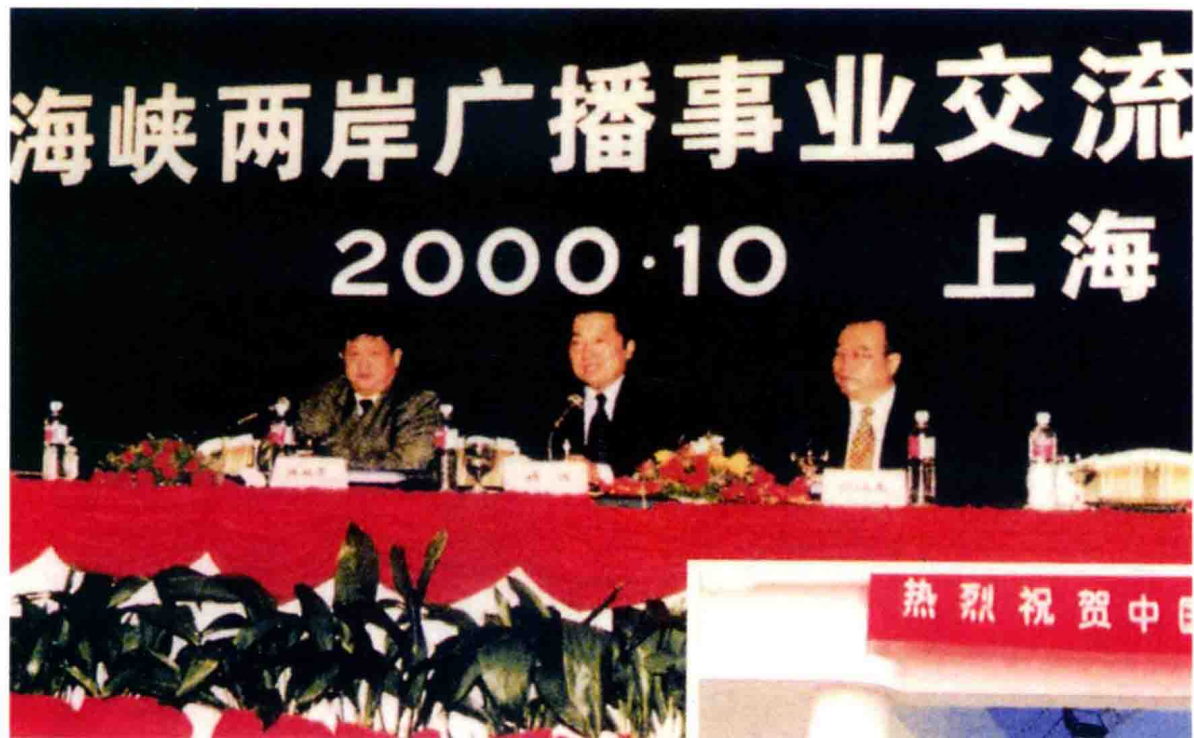
2000年10月23日至25日海峡两岸广播事业交流研讨会在上海举行