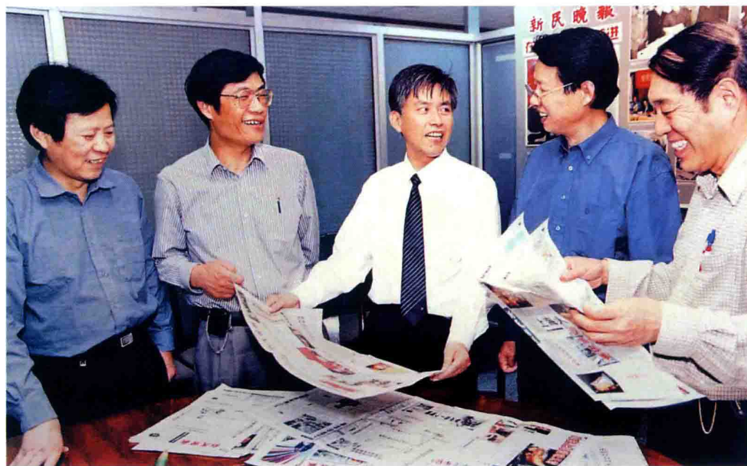
1998年文汇新民联合报业集团组建后的新民晚报新一届领导班子集体研讨版面