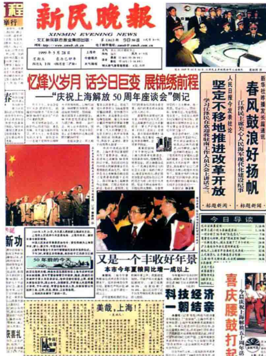
1999年5月28日《新民晚报》纪念上海解放五十周年50版特刊