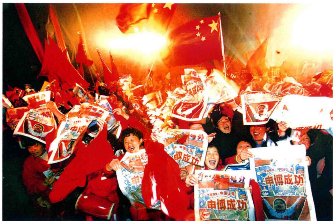
2002年12月3日《解放日报》出版“申博成功”号外