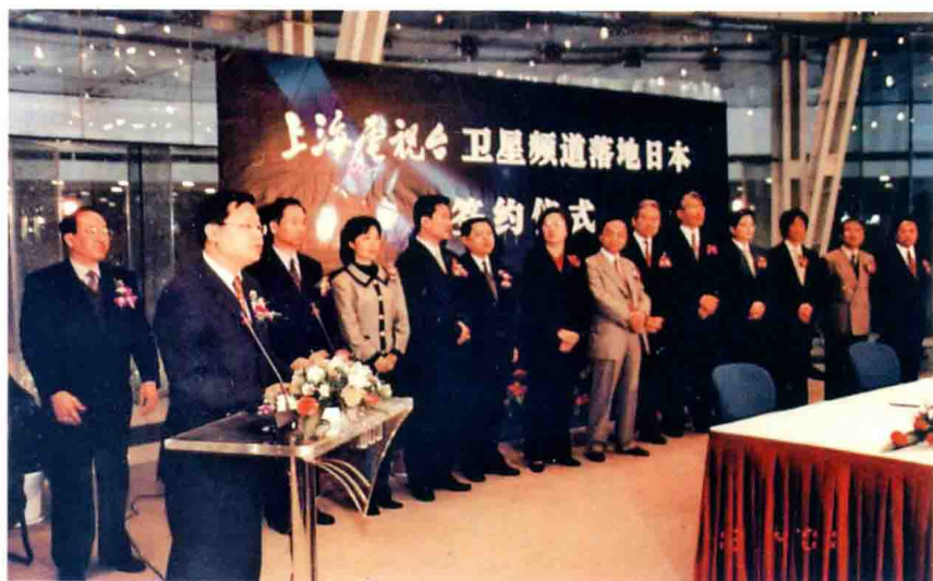
2001年12月4日上海电视台卫星频道落地日本签约仪式举行