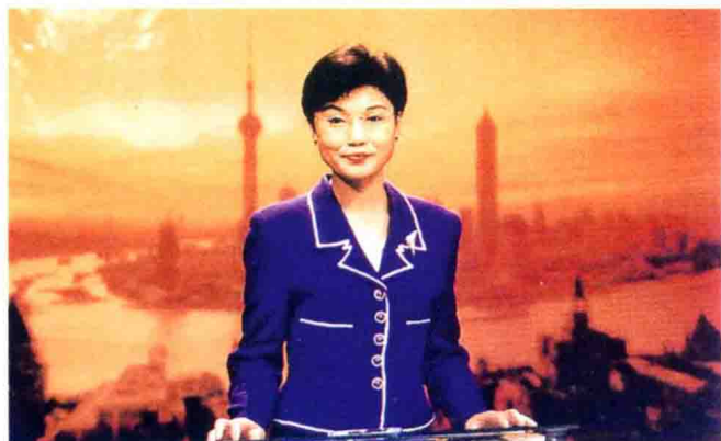
1993年2月1日上海电视台早新闻栏目《上海早晨》开播