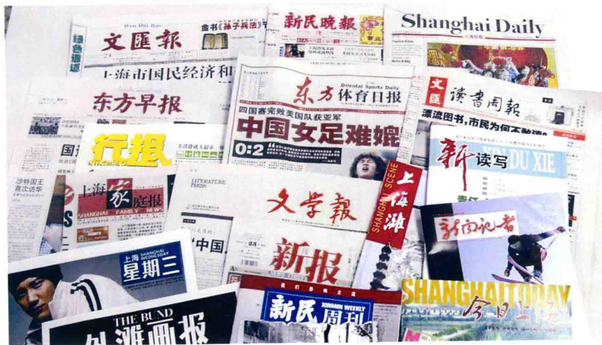
文汇新民联合报业集团主管主办的报刊