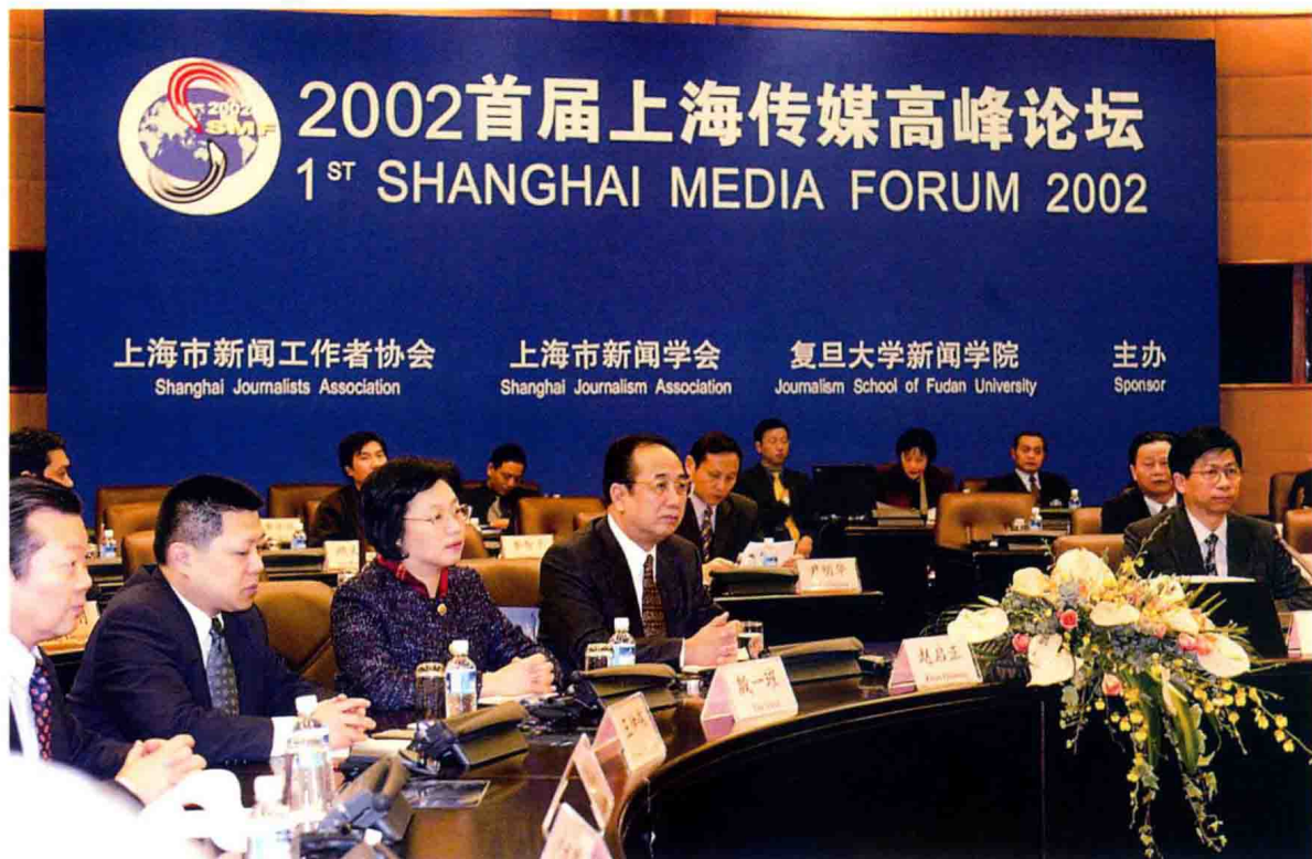
2002年12月5日至7日2002首届上海传媒高峰论坛举行。国务院新闻办公室主任赵启正(前左四),中共上海市委副书记殷一璀(前左三),市委常委、宣传部部长王仲伟(前左二)等出席