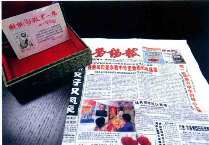
1997年7月1日《劳动报》出版庆祝香港回归丝绸报