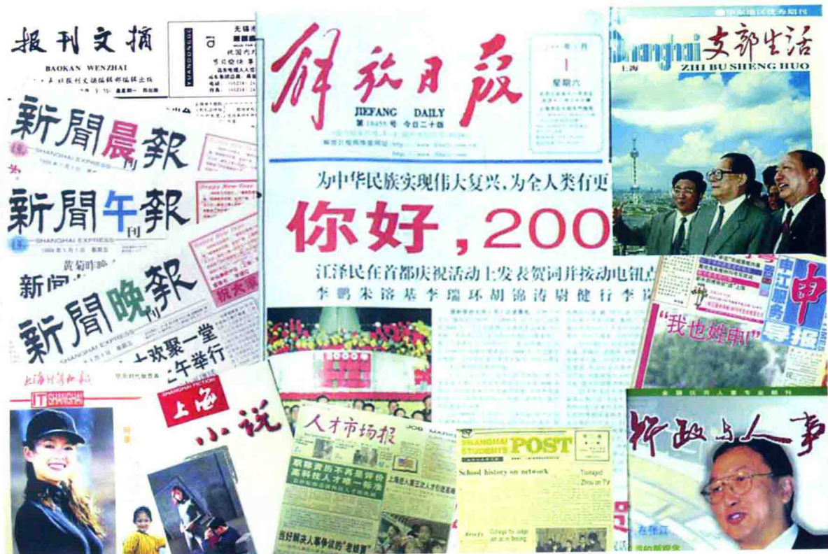
解放日报报业集团主管主办的报刊