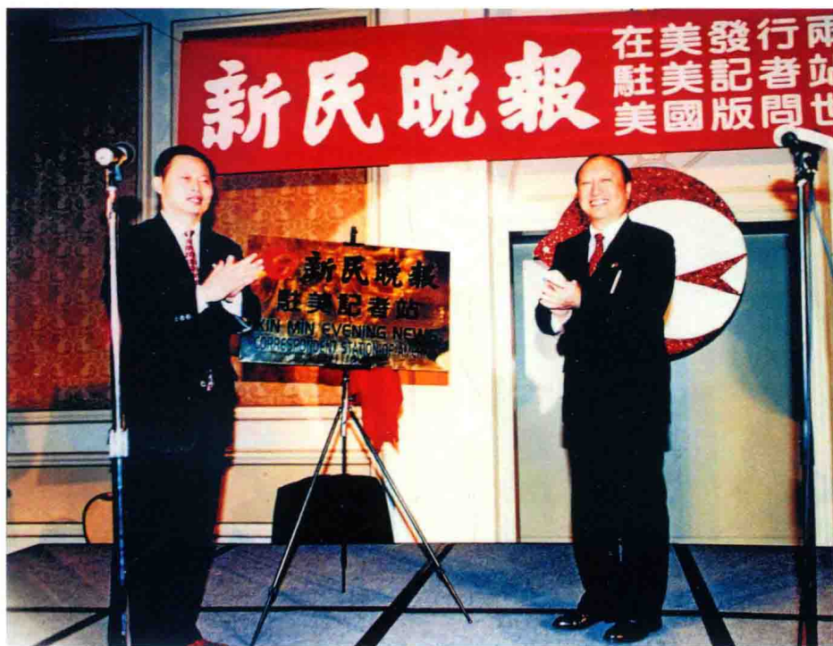
1996年11月9日新民晚报社驻美记者在洛杉矶成立，并推出《新民晚报》(美国版)。中共上海市委副书记、上海市市长徐匡迪(右)出席驻美记者站揭牌仪式