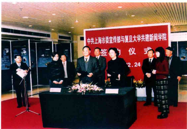
2001年12月24日中共上海市委宣传部与复旦大学共建新闻学院举行签约仪式，市委常委、宣传部部长殷一璀（前右一）、复旦大学校长王生洪（前右二）和市委副秘书长、宣传部副部长王仲伟（左一）出席