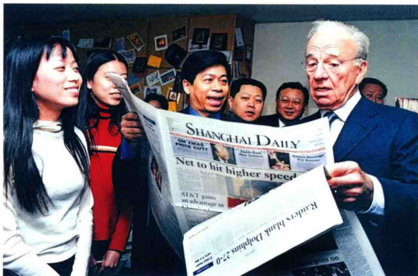
2001年1月8日上海日报总编辑张慈贇向到访的美国新闻集团董事长兼行政总裁默多克介绍版面内容