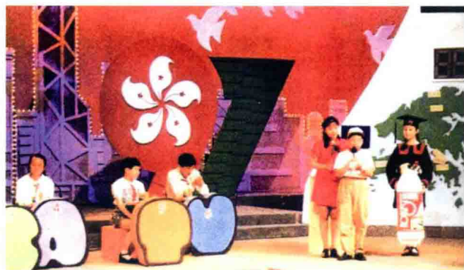
1995年10月1日上海有线电视台推出《小小看新闻》栏目