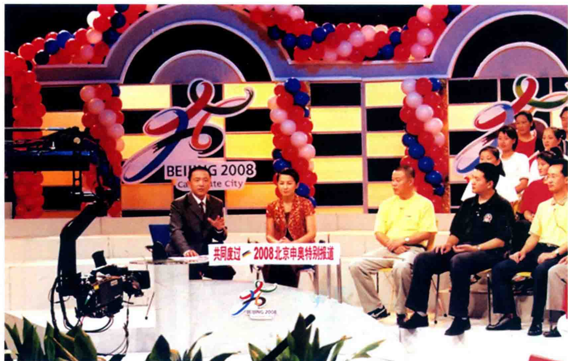
2001年7月13日上视“申奥”特别报道“共同度过”在演播室直播