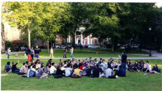
校园草坪上的耶鲁课堂

耶鲁纪念馆是为了纪念在第一次世界大战中牺牲的耶鲁校友而建。左图为纪念馆门口的石碑。