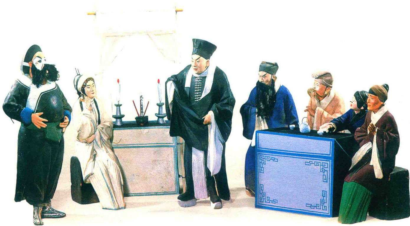
武松省亲(张玉亭) © “泥人张”彩塑

总之，无论是原始淳厚质朴的彩陶器物，粗犷古拙的男女奴隶俑，已形成飘逸迢然之风的魏晋南北朝