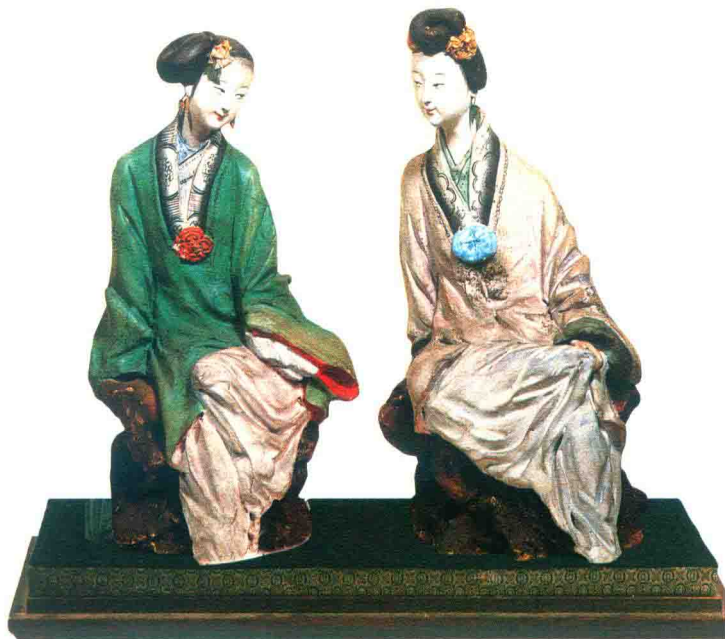
少女(张明山) © “泥人张”彩塑

泥彩塑的滥觞可以追溯到五六千年前的新石器时代，原始的先民在自己的劳动中逐渐将单一的物象复合化，显示了类型化的美，并把不同形象的物品经过加工琢磨变成相同的形象，显示同一性的美，于是他们对物象审美意识与意趣的思维闪光，影响并促成了中国民间泥彩塑艺术的形成。后来，秦汉以前作为“明器”使用的彩俑出现，使这种将古拙质朴的造型与彩绘结合的技巧成为了隋唐以后彩塑发展的基础。而隋唐彩塑又在新的外来艺术滋养中产生了新的变化，从朴素到精炼，从质朴到丰富，但又不失以前追求神韵的特点，同时在其艺术实践中又不断地提高和完善了造型与彩绘结合的技巧。