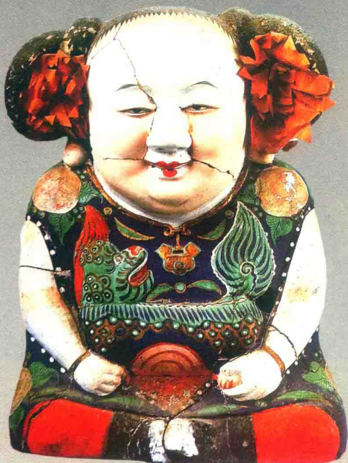
阿福（清代）◎惠山泥彩塑