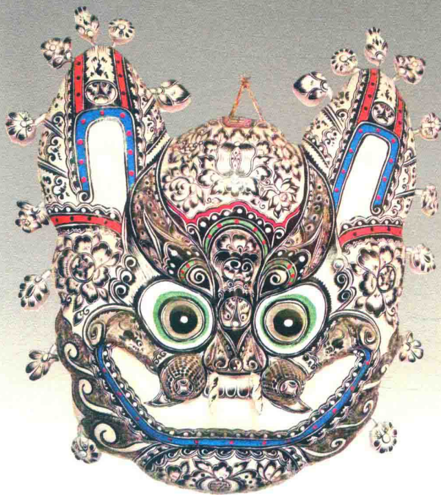
挂虎（胡深）◎凤翔泥彩塑

中国民间泥彩塑植根于中华文化沃土之中，它循系中华文化的优秀文脉，生发繁衍，逐渐形成数量众多、规模宏大、风格迥异的艺术形式。它是世世代代人民群众精神力量的体现，是高度智慧与卓越创作才能的结晶。