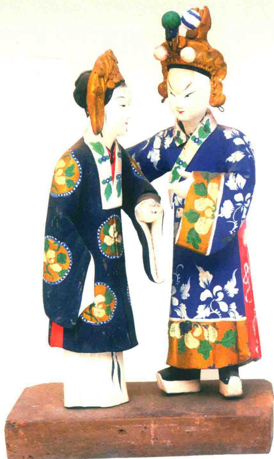
凤仪亭（丁阿金）◎惠山泥彩塑

彩塑，融凝外来艺术日臻创新成熟的隋代彩塑，以细腻完整的手法塑造了雍容丰润的唐代彩塑，还是以写实流畅手法表现人物内心情感、刻画人物性格和形象特征的宋代彩塑，以及求索于生活中人的形态与性格，富于典雅装饰之风的元、明、清彩塑，它们的创作时代与创作条件不尽相同，但所追求的艺术目标是一致的，即造型圆满完整、形态优美生动、色彩纯朴明快。