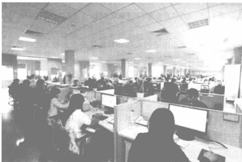
图0-2 现代人被工作间阻隔的工作空间

其二，人和人的异化。传统的生产生活方式为人类面对面相互交流提供了时空和平台，现代化高效率快节奏的生产、生活使现代人必须专心致志、全力以赴地工作，人们很难像以往一样边工作边聊天。一个一个的工位更是阻挡着人们面对面的交流和沟通（见图0-2）。