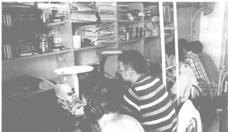
图 0-3 大学生宿舍里或看手机或上网，人与人之间交流有限

另外，人们在生产生活中的关联却日渐紧密，人与人之间的交往更多屈从于物质现实利益而非精神心灵的沟通共在，人与人交往异化为人与物的利用。