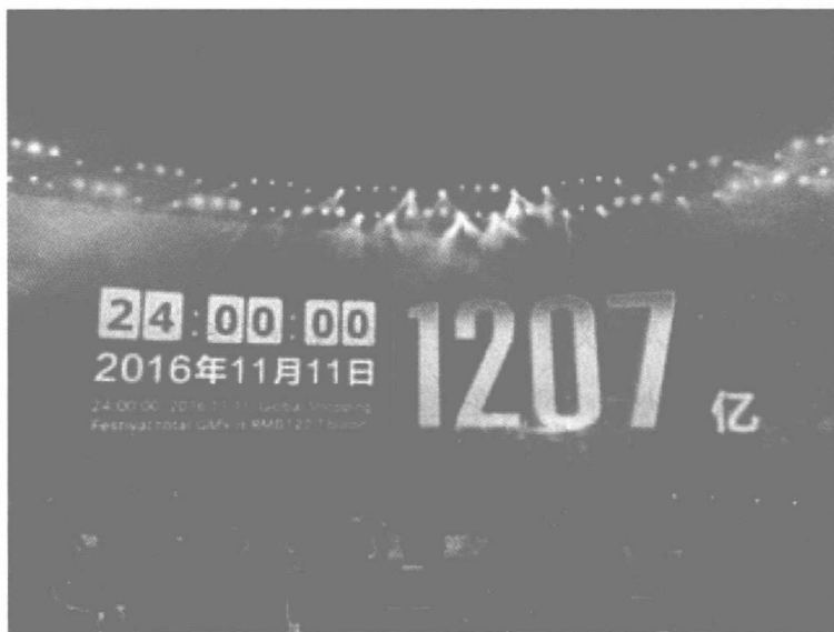
图0-1 天猫2016年“双十一”成交额展示着网购的疯狂

现代性危机包括三个方面：其一，人和物的异化。人类认识自然改造自然是為了人类拥有更多更好的生活物质。这些生活物质本是为了人类服务而存在，但现代化生产创造出越来越多的生活物质并不是为了人类更好地生活：车间经常会为了生产而生产，人们经常会为了消费而消费。人不再是物的主人，物反而变成了人的主人。琳琅满目、种类丰盛的生活物质让人眼花缭乱，失去了选择的主动性和能力，这些色泽鲜艳形状独特的生活物质用其华丽的外表诱惑着人们，使人们一步步走近它、触摸它、玩赏它，到最后倾囊而出占有它。每逢年节，尤其是在“双十一”时，许多人大喊“剁手”却又不自主地掏钱购物，此即“物为主人”的一个表征（见图0-1）。