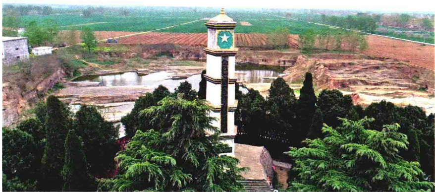
新四军第四师十一旅涡北抗战烈士纪念塔

辉山村所在的涡阳是一个文化底蕴丰富的县域，相传有“老子故里、天下道源”的美称，道家文化深刻地影响一代又一代辉山人的生存哲学；辉山是一个充满红色记忆的村庄，众多开国将军在此留下保家卫国的英雄足迹。此外，辉山是一个传统农耕乡村，依水为居、以土为生、安居乐业是辉山人的千年梦想。