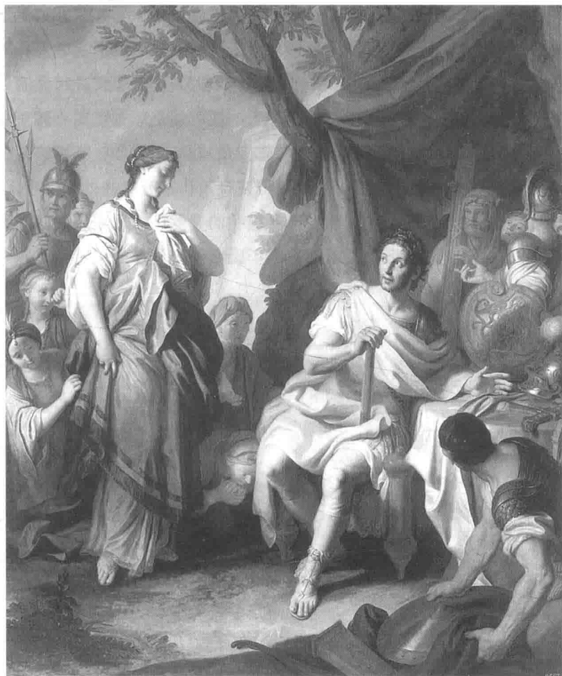
罗克珊娜与亚历山大