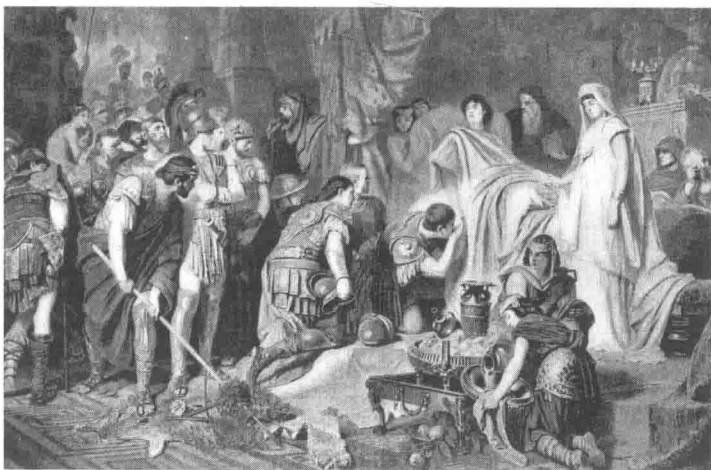
亚历山大大帝驾崩

公元前 323 年 6 月，所向披靡的亚历山大大帝在巴比伦驾崩。之后，他手下的将军们聚到一起，瓜分了马其顿王国，而马其顿王国只有亚历山大大帝才能维持统一。因为印度的位置偏远，所以马其顿国王不得不派官员与当地王公共同治理。公元前 321 年，在叙利亚达成的《特里帕拉迪苏斯分封条约》 ① 生效。《特里帕拉迪苏斯分封条约》规定：西比尔提亚斯 ②