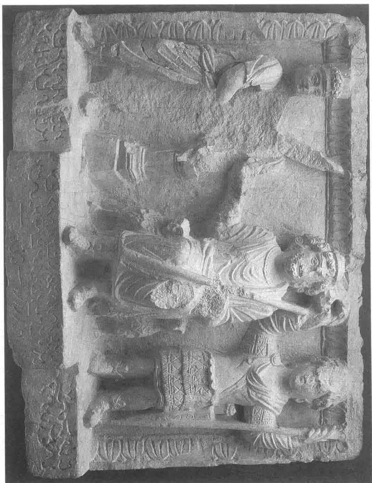
塞琉古一世（前 358—前 281）（中）