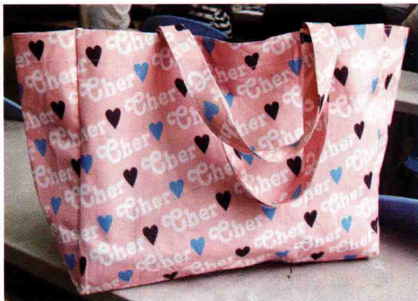
图1-1 (18) 休闲包平面图案