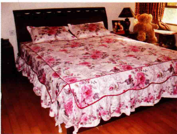
图 1-1 (17) 床上用品平面图案