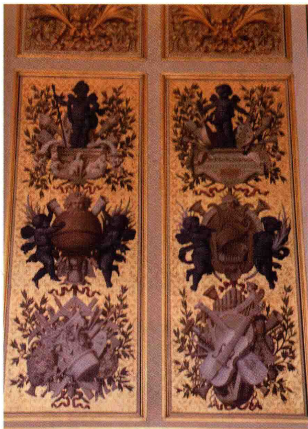
图 1-1 (14) 法国巴黎罗浮宫内装饰图案之二