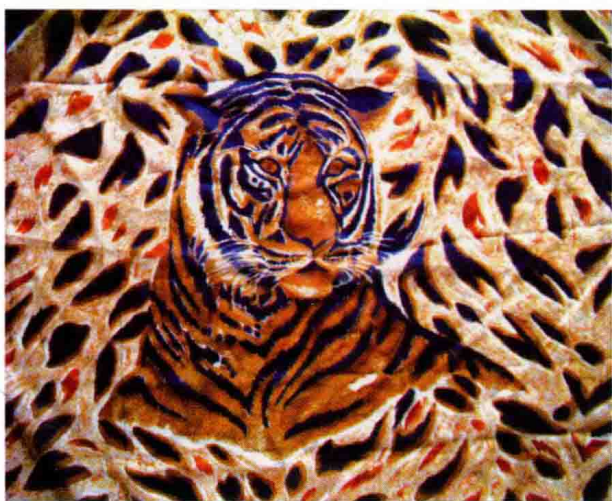
图 1-1 (8) 动物图案