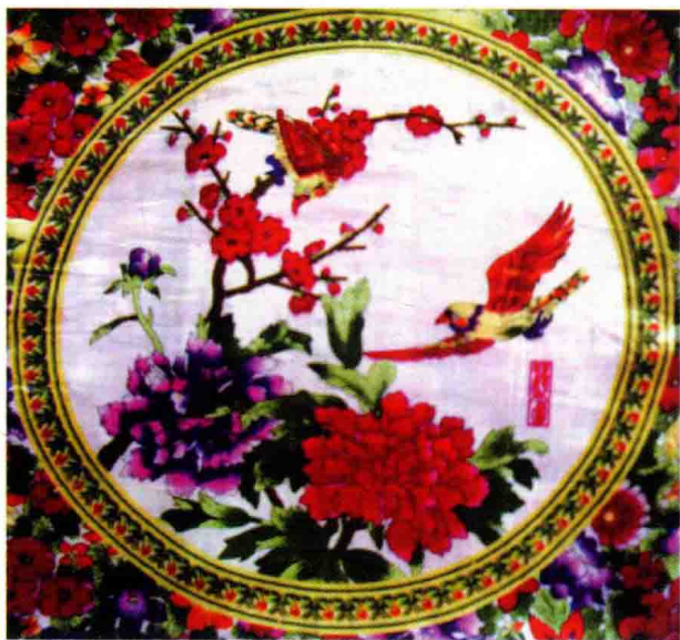
图 1-2(4) 抱枕——写实花鸟图案设计