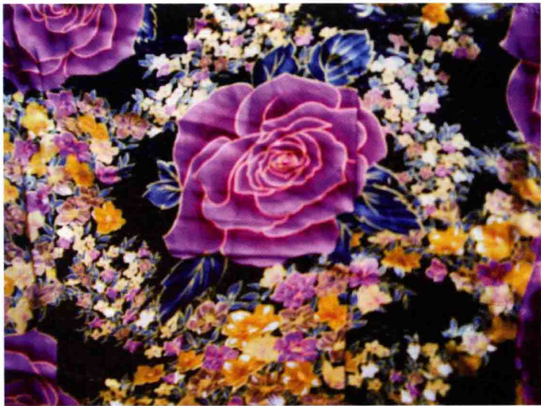
图 1-1 (7) 花卉图案

图案的内容是多方面的,有花卉、动物、人物、风景、文字符号等设计内容。如图1-1(7)~图1-1(10)。随着社会的进步以及电脑