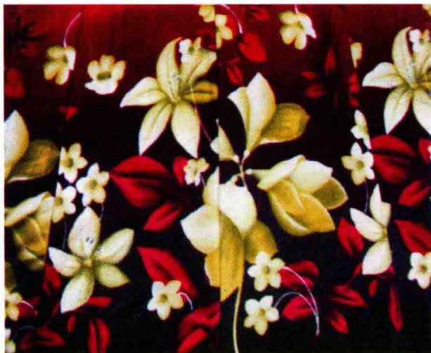
图 1-2 (3) 写实花卉图案设计