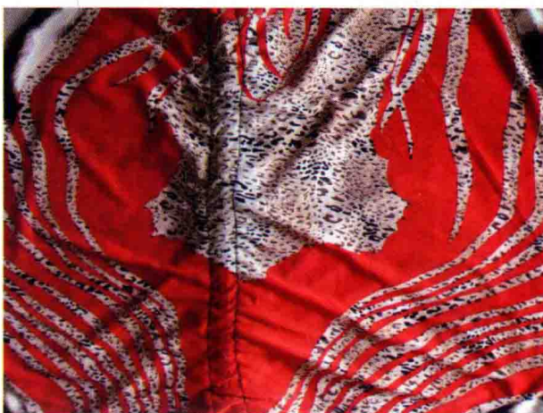
图 1-2 (8) 服装面料图案

素。色彩完全是主观处理，依据图案设计需要来设计色彩，视觉上没有明显的物象特征。如图1-2 (5) ~ 图1-2 (8)。