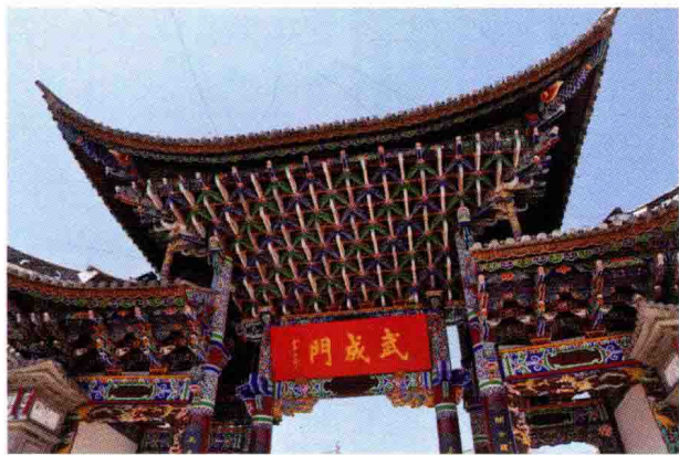
图 1-1 (1) 中国云南建筑图例

具图案、生活小饰品图案、纺织类用品图案、服装饰品类图案、小玩具图案、家电与包装图案和各种食品与包装图案等。如图1-1(3)、图1-1 (4)。精神生活方面有供人们欣赏的装饰画、装饰壁挂、陶瓷装饰图案、艺术作品等。如图1-1 (5)、图1-1 (6)。可以说图案的表现形式在生活中无处不在，图案的应用极其广泛。