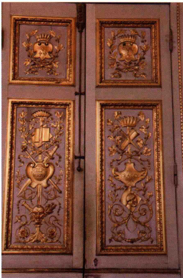
图 1-1 (13) 法国巴黎罗浮宫内装饰图案之一

立体图案是指采用立体手法设计和表现的图案，如雕刻图案、镂空图案、刺绣图案、面料拼贴图案等。如图1-1(13)、图1-1(14)。