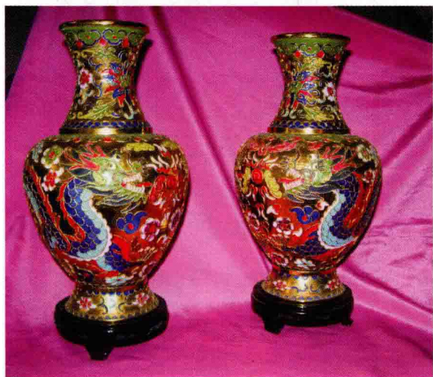
图 1-1 (3) 日用装饰品——景泰蓝花瓶