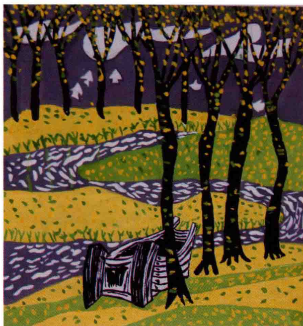
图 1-1 (10) 风景图案