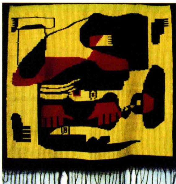
图 1-2 (6) 壁挂抽象图案