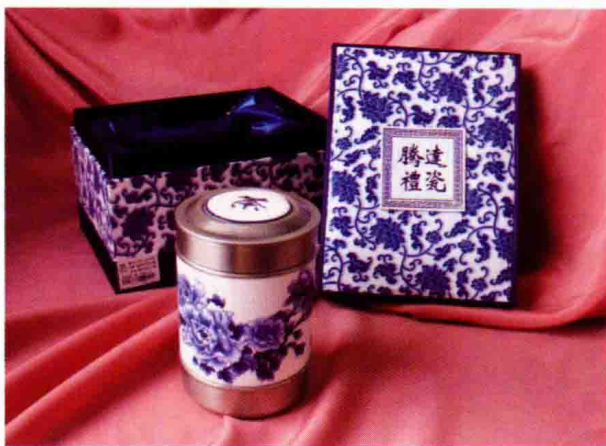
图 1-1 (16) 陶瓷茶杯平面图案