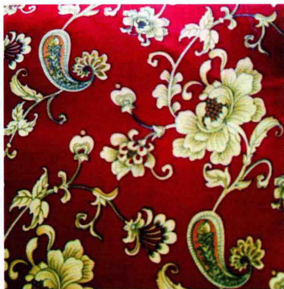
图 1-2(1) 抱枕——具象花卉图案