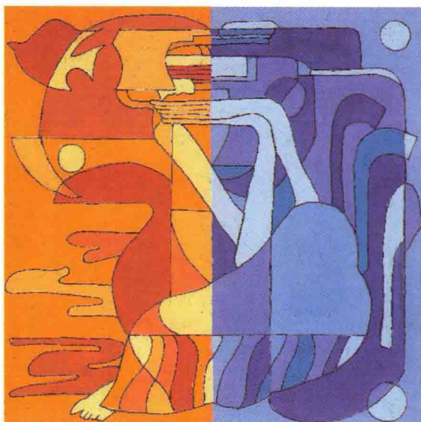
图 1-2 (7) 抽象图案设计 (学生邓燕妮)