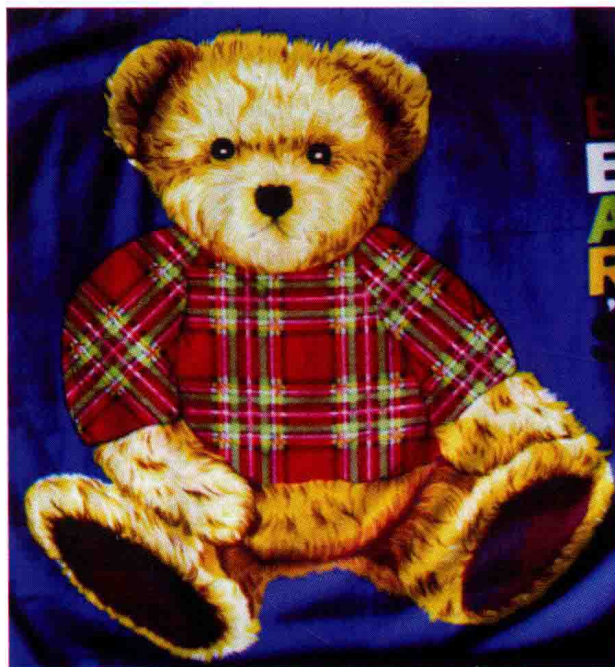
图 1-2 (2) 抱枕——具象动物图案

抽象图案——是指设计师不依据自然物象特征,而是采用抽象变形或夸张的表现手法来设计图案。其造型、色彩完全不是自然物象,而是抽象的几何符号、几根线条等为设计元