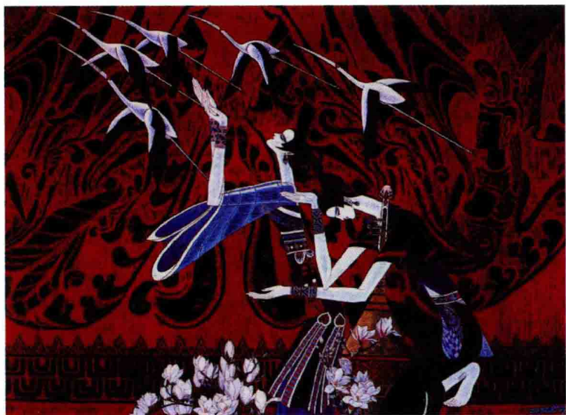
图 1-1 (5) 装饰画《艺术女神》(丁韶光)