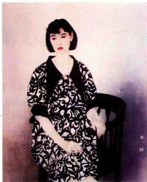
图 1-1(6) 艺术作品《子君》(何家英)