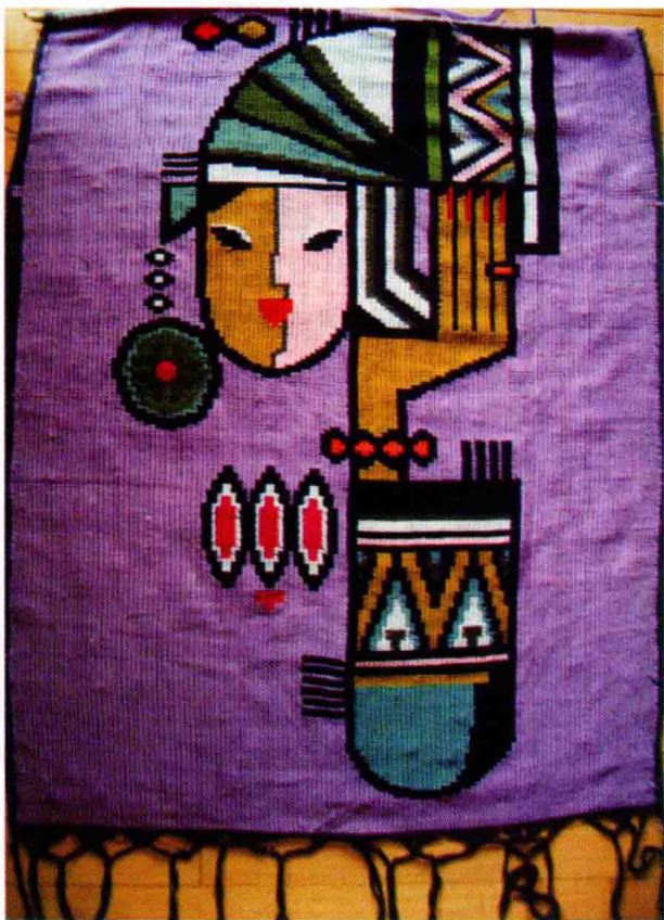
图 1-1 (9) 人物图案

更新换代,使美术设计(包括图案设计)有了更大的应用空间,极大地提高了设计领域的成效。