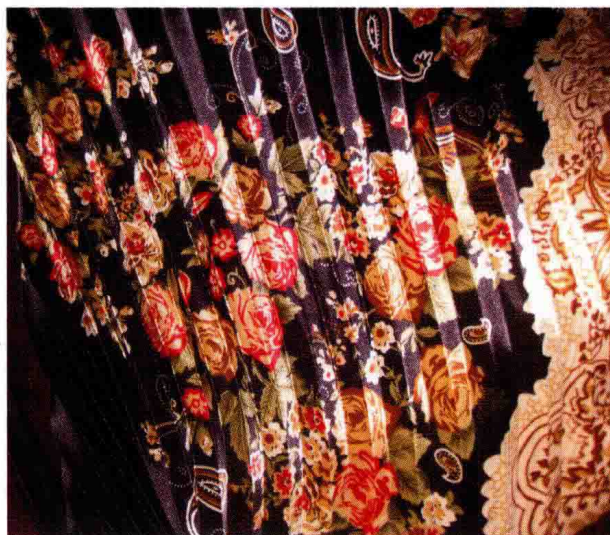
图 1-1 (4) 服饰面料图案