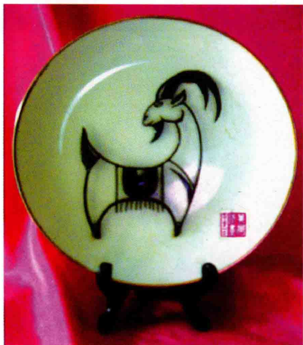
图 1-1 (15) 装饰盘立体图案

图案的设计必须符合物体造型特点与工艺制作要求，才能达到图案与物体的完美结合。例如：酒具、餐具的图案设计必须符合其造型特点。服装上的图案也要符合其服装装饰特点来设计。有时可以是面料图案设计，但单色的面料可以用立体图案或其他色彩图案来设计表现，使服装更美。如图1-1 (15)~图1-1 (18)。