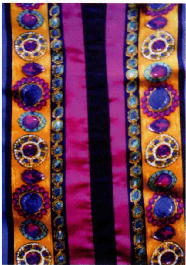
图 1-2 (5) 服装面料图案