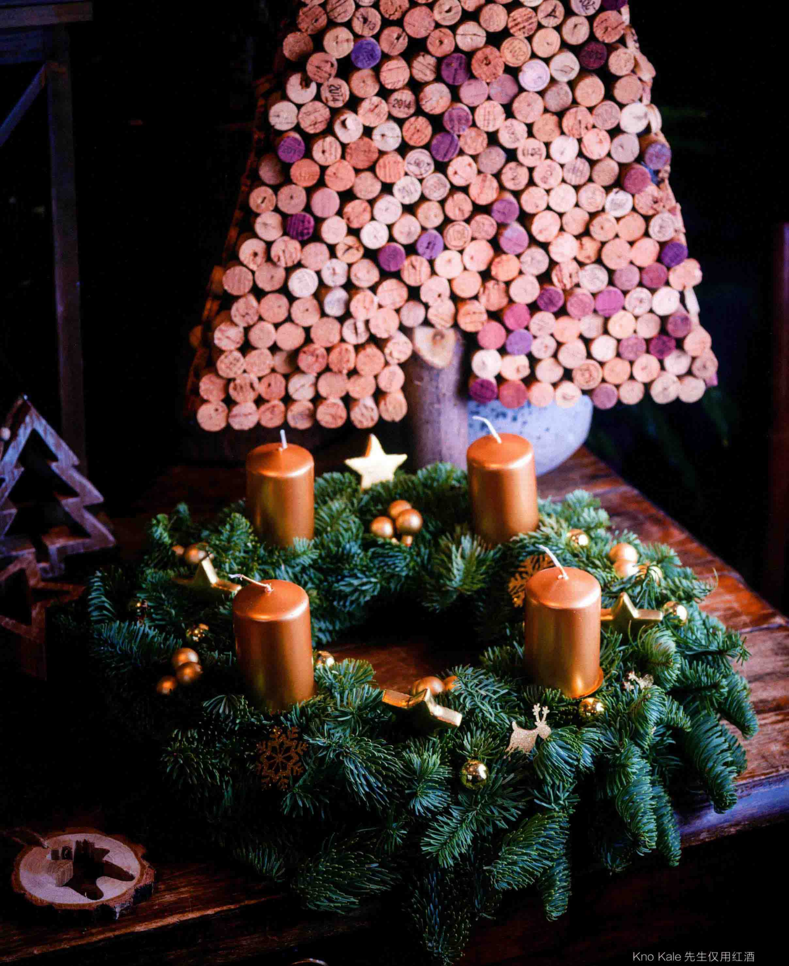
Kno Kale 先生仅用红酒的软木塞做成的圣诞树手工艺品。出人意料的独创性和软木塞散发的柔美色调俘获了众人的心。