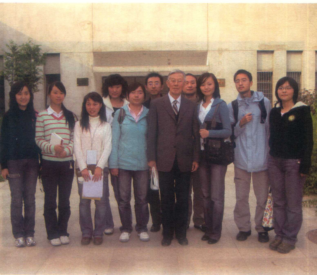
2007年在西北大学105周年校庆专题演讲后与部分本科生合影