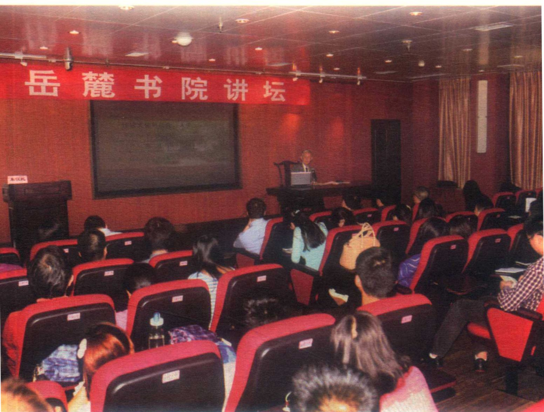
2014年5月在湖南大学岳麓书院演讲