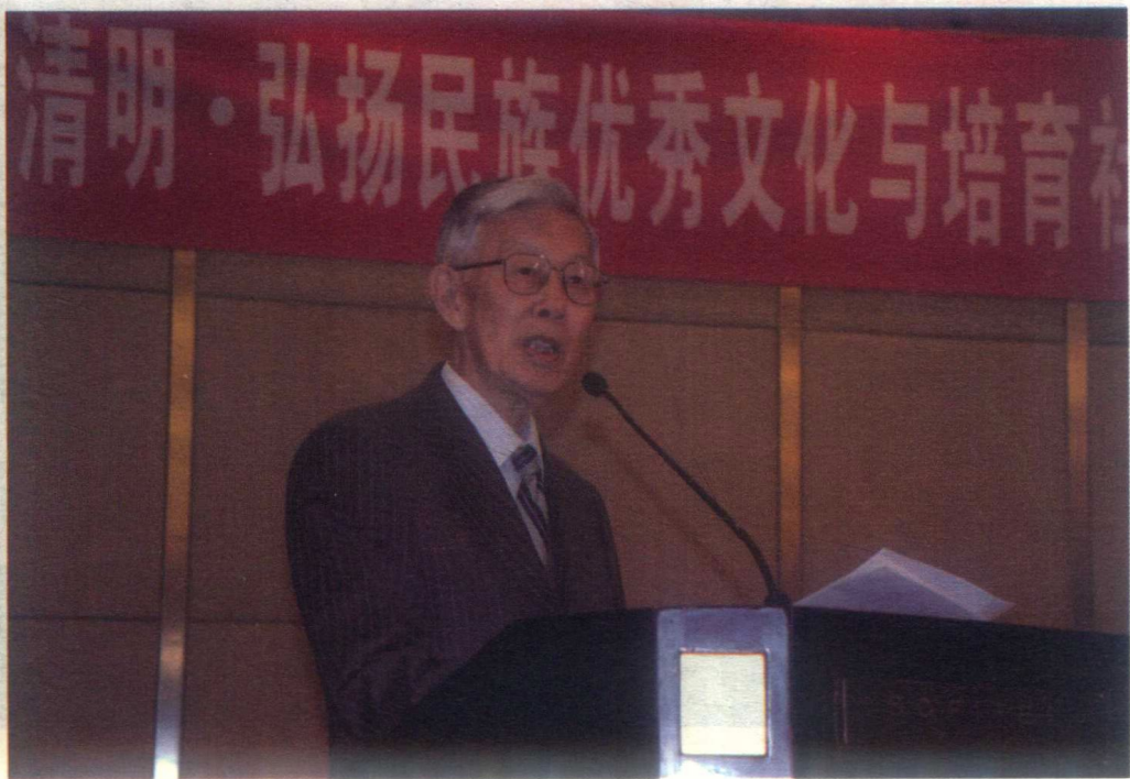
2013年4月在“清明·弘扬民族优秀文化与培育社会主义核心价值观” 学术交流会上演讲