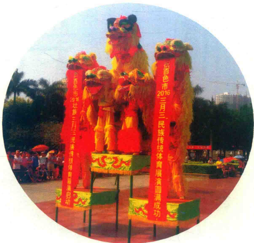
图 1-9 “瑞狮争艳”

“瑞狮争艳”由六至八头狮子组成群狮阵势,在三张八仙桌叠成的楼台上,以活泼欢快的方式争相嬉戏,表演生动活跃、精彩绝伦的造型动作,以此表示对广大观众的欢迎和谢意。