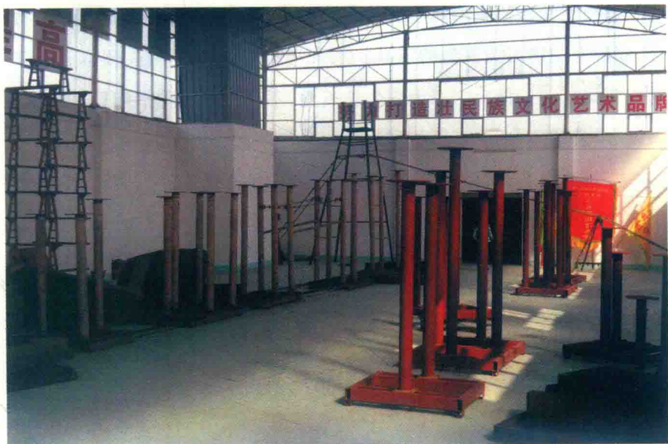
图 1-2 田阳壮族狮舞所需器材和训练场地