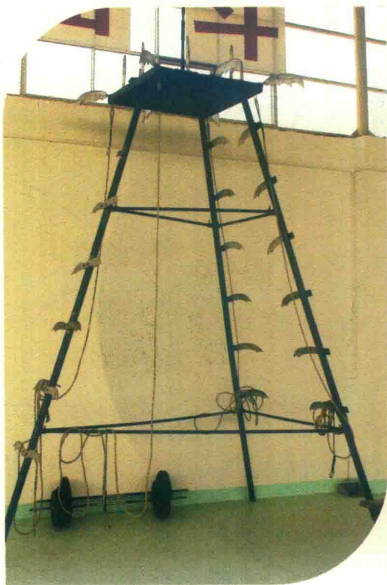
图 1-7 “刀尖狮技”所需器材“刀山”