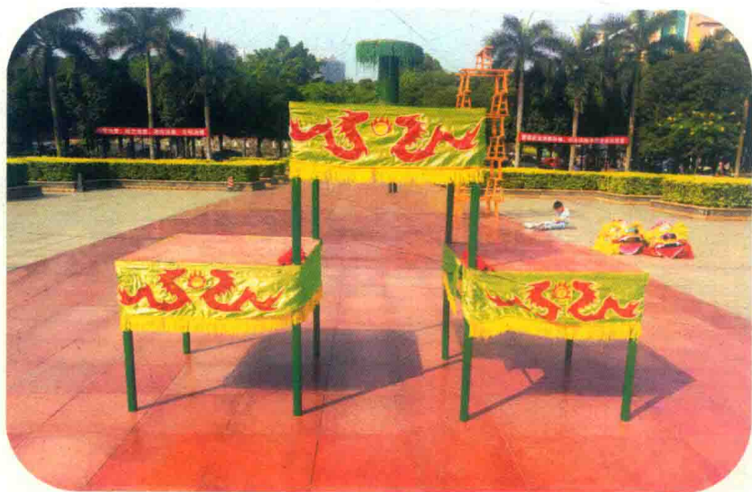
图 1-5 “瑞狮争艳”所需器材“楼台”