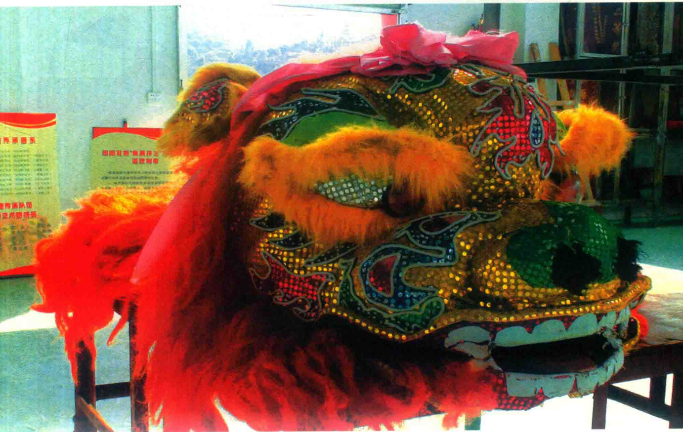
图 1-3 狮头