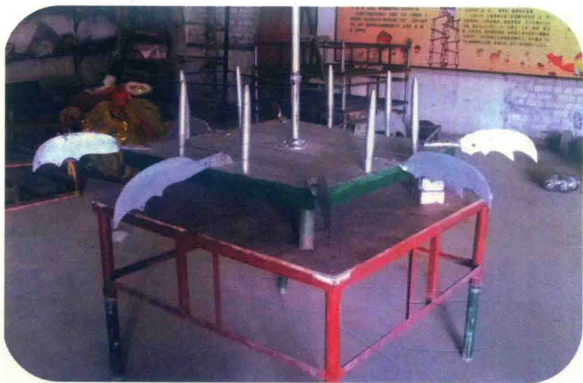
图 1-4 “刀尖狮技”所需器材“刀尖”

“高桩”是表演“高桩飞狮”的器材，由几组高低各异的圆桩，组合成一条长 14.6 米，高 2.6 米的长形高桩。