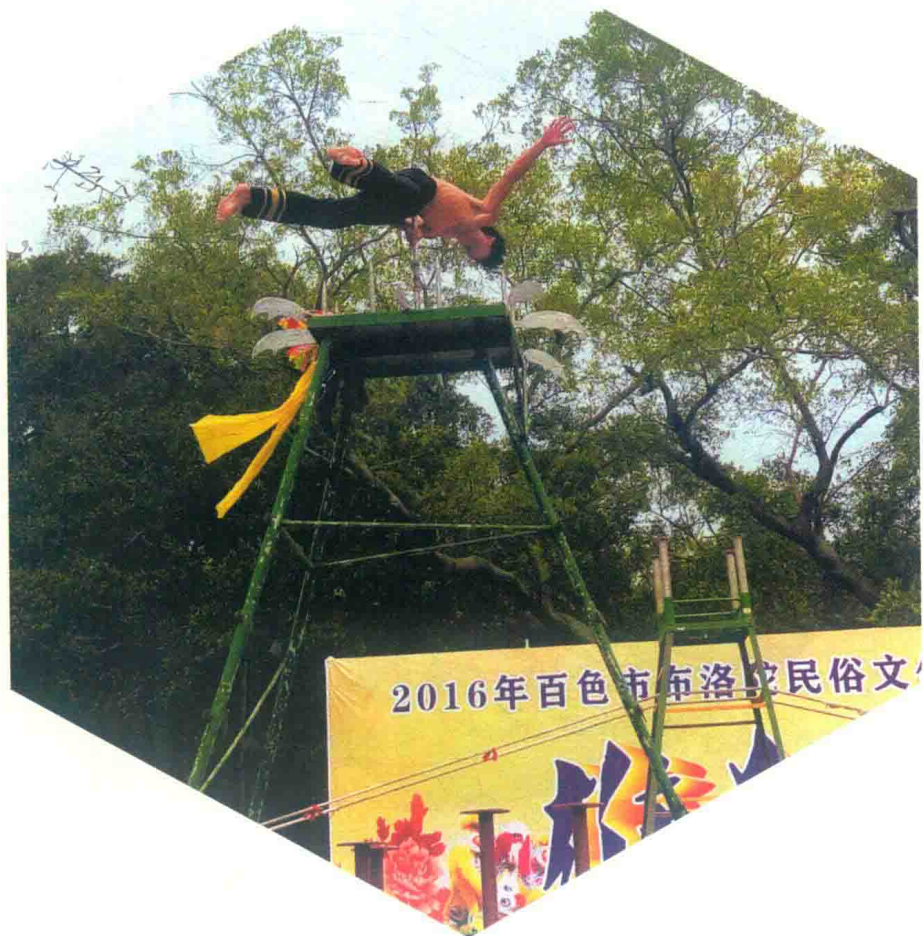
图 1-10 引狮人在刀尖上旋转

“刀尖狮技”，三位青年赤脚舞狮，爬上安装有锋利刀刃的架子顶，并在架子顶的刀架上行走、腾跃。其中，引狮人经过数年苦练，可俯身在刀尖之上，手脚张开并旋转。“刀尖狮技”曾被国内外专家誉为“世界一绝”，并在“中华首届狮王大赛”中夺得“北狮王”称号。