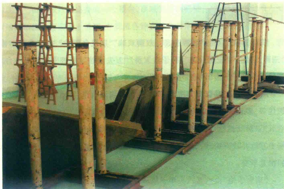
图 1-6 “高桩飞狮”所需器材“高桩”