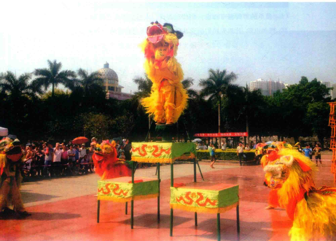
图 1-1 舞狮是广西民间最常见的一项民间娱乐活动

田阳壮族狮舞(民间亦称舞狮)相传距今已有近五百年的历史。据史料记载,在明朝嘉靖三十四年(1555年)十月,壮族抗倭英雄瓦氏夫人率军东征抗倭,获胜后回到田州(今广西田阳县)时,壮族父老乡亲曾组织传统的舞狮表演,热烈欢迎从前线立功归来的英雄。当时群狮齐舞,人头攒动,盛况空前。自此田阳狮舞开始闻名,到清代,舞狮已经成为广西民间最常见的一项体育娱乐活动。