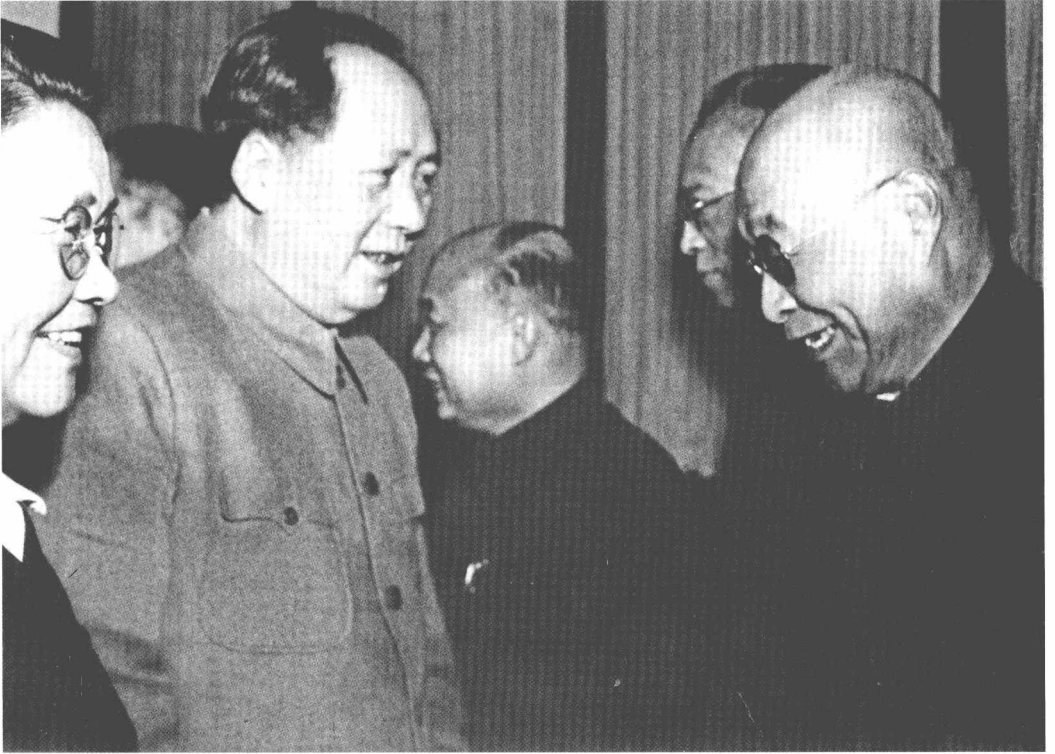
1956年2月，毛泽东在全国政协二届二次会议期间接见施今墨先生（右一），左一为原卫生部部长李德全同志。