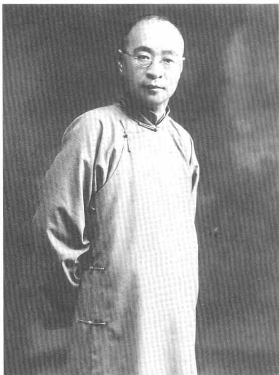
施今墨中年时期照片（一）