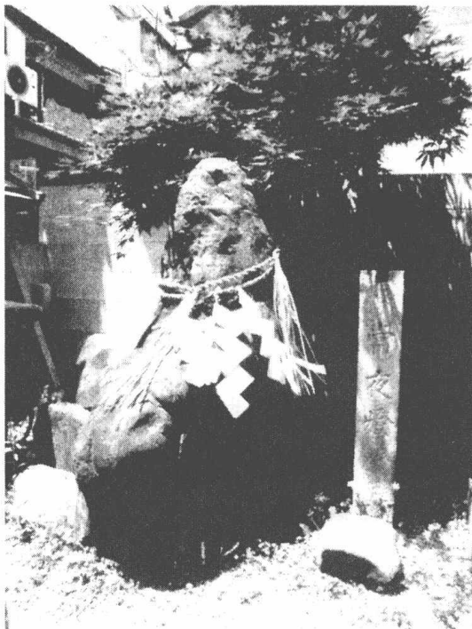
人为何将自然界视为神(奈良 猿田彦神社)

的工作,回答的最主要的问题是:人类为何需要神?同时,这也是探寻人类本质的重要一步。