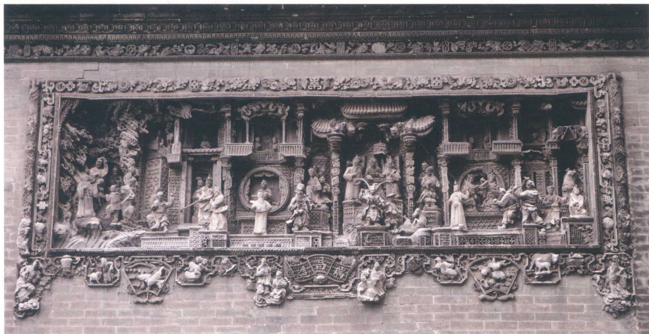
图1-6 广州陈家祠堂外墙的砖雕