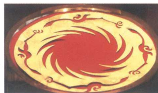
图1-5 “太阳神鸟”金饰 (收藏于成都金沙遗址博物馆)