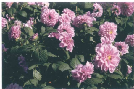
图 1-8 菊花