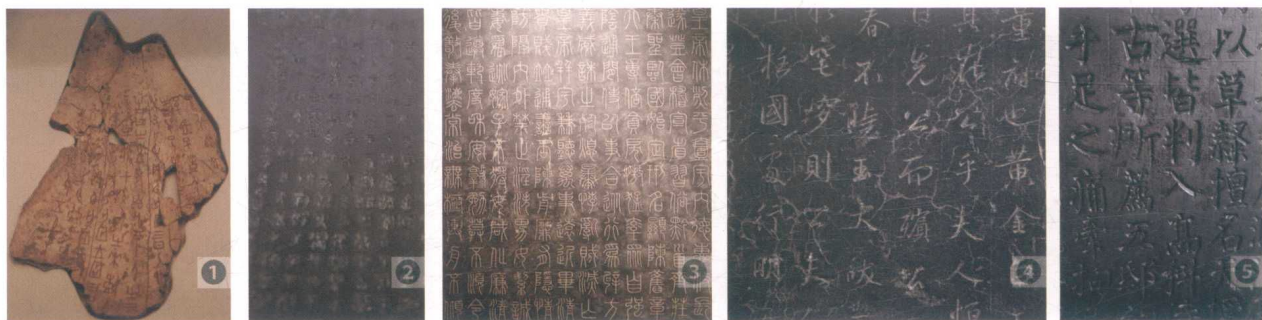
图1-3 文字演进的“文物”

文字（图1-3），作为一种语言形态，承载了中国文化，从而让我们博古通今，可以应用与开发前人留给后人的文化资源。考古学利用地质学和生物学的理论与方法，提供了地层学与器物形态学的方式与方法。器物形态学又称标型学或型式学，是通过对不同时代、不同文化或同一文化的不同阶段、不同地区的器物就其型态进行排比，从而探索其年代与变化规律的理论与方法。诸如居址、墓葬或其他遗迹的形制，铜、铁、瓷、石等器物均可以用其进行分析判断。通过分析判断，以确定器物所属的年代，并了解当时社会的状况，人们生产与生活的方式等。