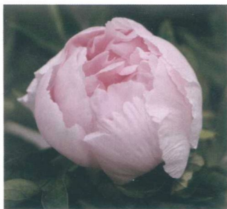
图 1-7 牡丹花