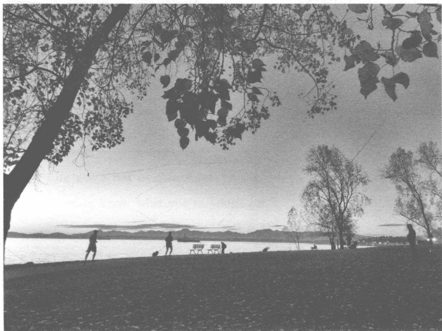
图 0-2 夕阳下的西雅图海湾（拍摄于 2016 年）

不断地问人生的意义是什么,这种发现不仅给我带来了物质财富的增长,更多的是发现这样亘古不变的精神财富给我带来生命的愉悦,这也是我认为的生命第三层次的意义所在了。传播任正非和贝佐斯等一代优秀企业家身上凝结的优秀素质、创新思维和企业家精神,对我们当前国内的教育和创新创业都具有正能量。