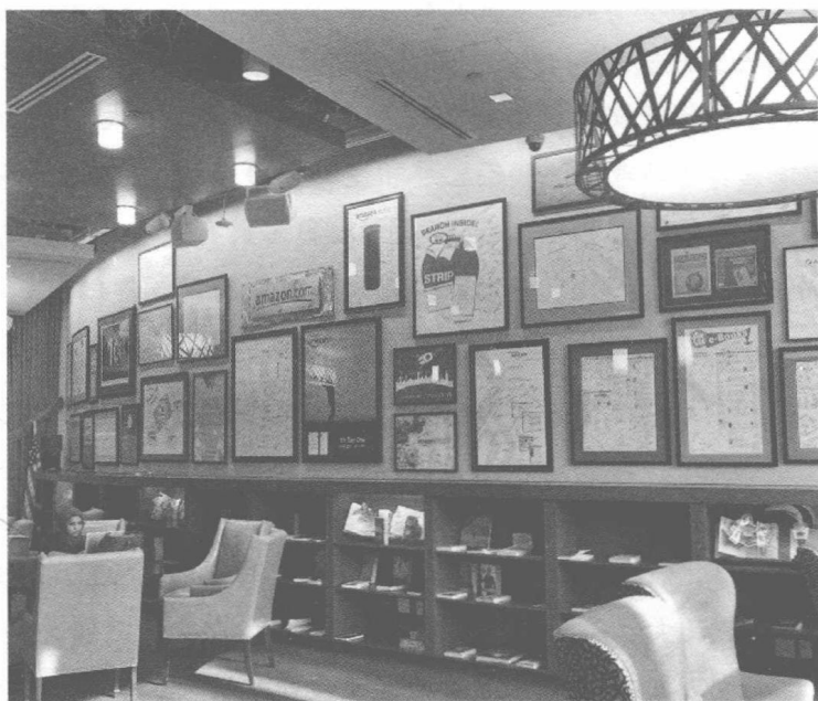
图 0-1 亚马逊总部大堂

雅图寒冷的冬天,被亚马逊和贝佐斯深深征服。贝佐斯的企业家精神和 管理创新理念深深吸引了我。记得那时漫步在西雅图的南联合湖,穿梭 在华盛顿湖茂密的森林,看海边的海鸥与归航游轮齐飞,留恋针塔的夜 景,静静地待在华盛顿大学古老的图书馆,不高大但带着浓浓书香和亚 马逊 Logo 的大堂(见图 0-1 亚马逊总部大堂),带给我的是探索自然和 学习研究公司的乐趣。在那次独步夜色阑珊的海边(见图 0-2),看着 靠港的游轮时,让我再次想起了华为、想起了任正非。