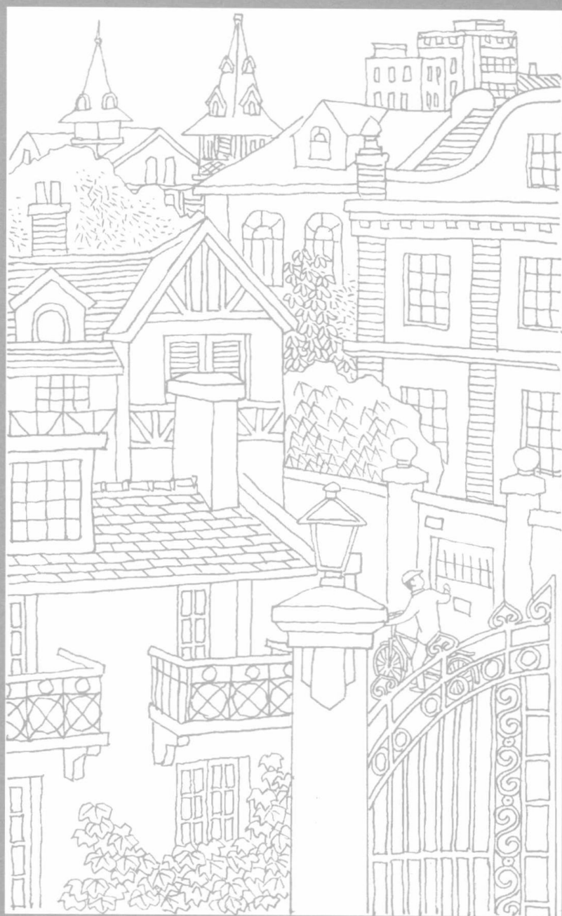
西区老洋房（戏称“上只角”）