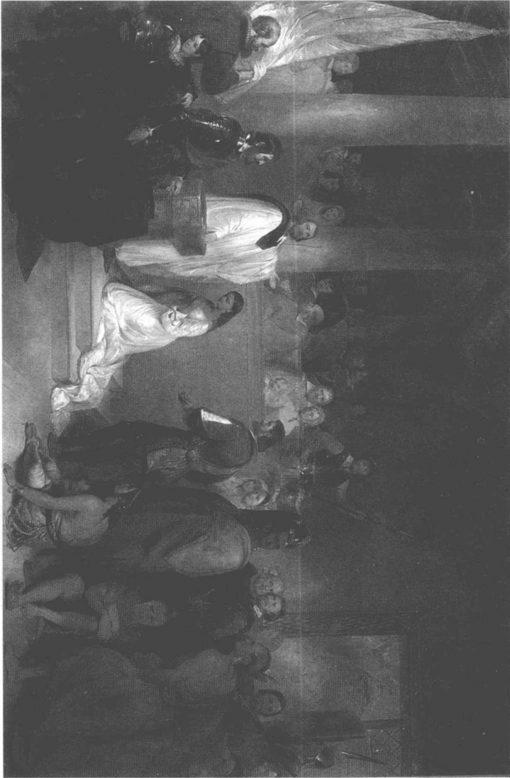
印第安少女波卡洪塔斯皈依基督教