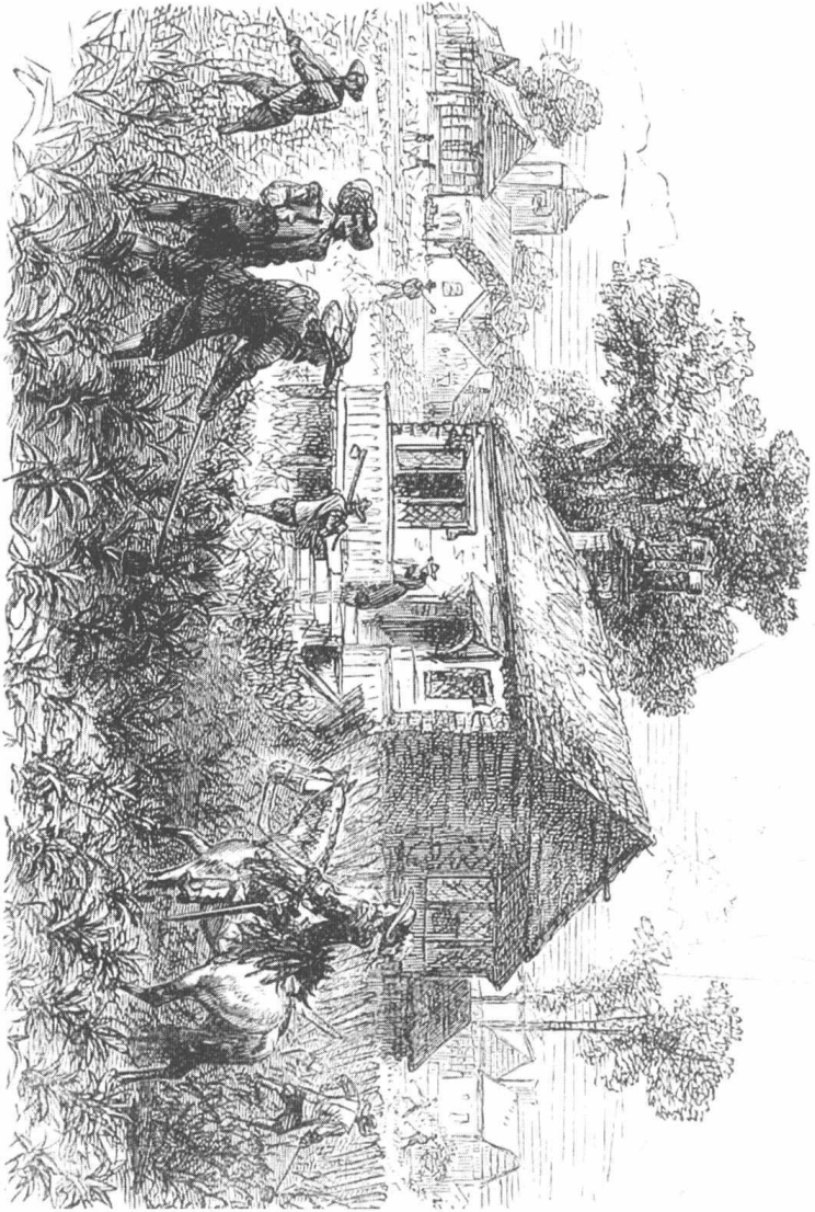
詹姆斯敦拓殖点生产的场景