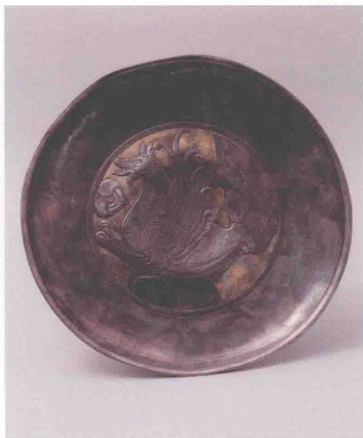
彩版一 银盘 (OS49)