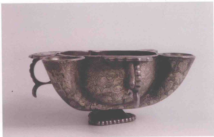
彩版三 银灯 (OS291)