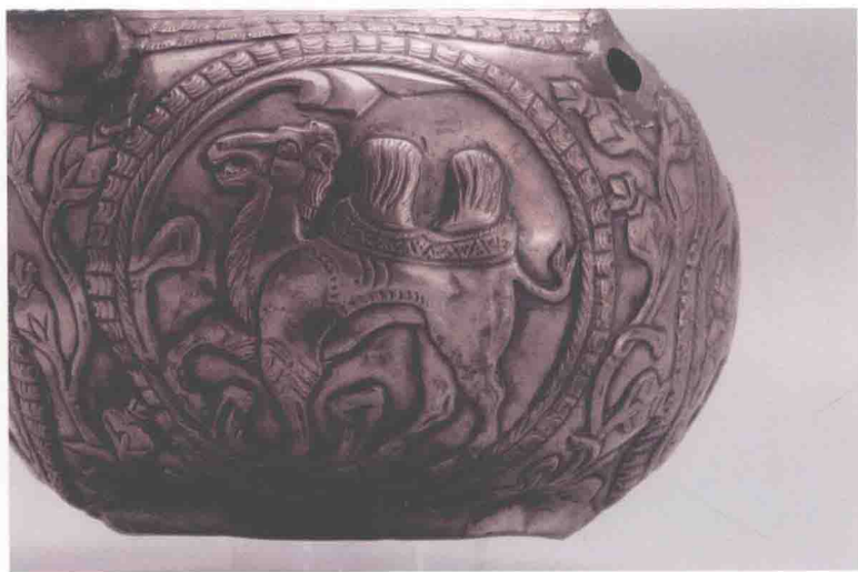
彩版四 图鲁舍沃村银灯 (SM55)