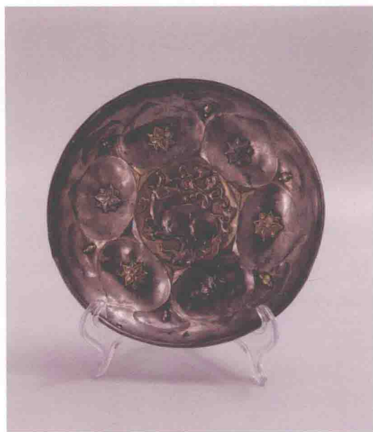
彩版二 银碗 (NSP1)