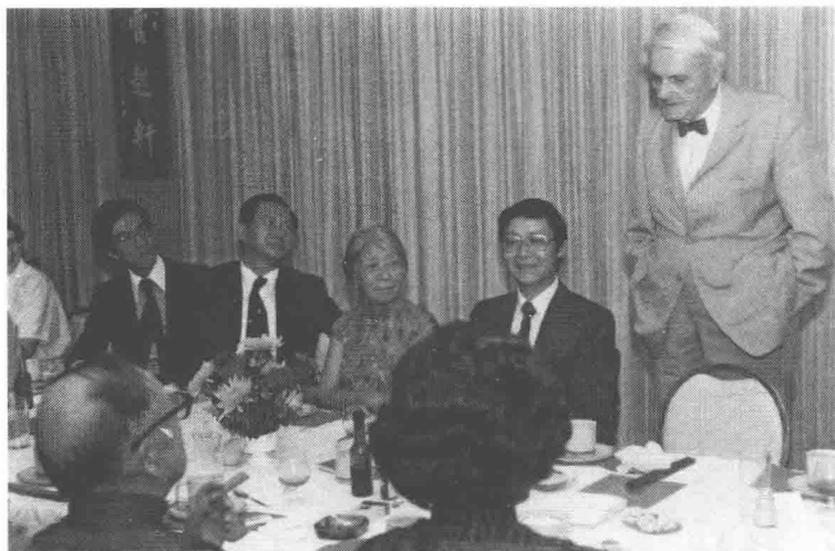
李约瑟博士（右一）来访，在香港中文大学新亚书院云起轩宴聚（1979年）