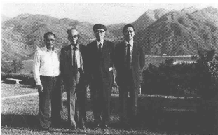
杨勇（左一）、饶宗颐（左二）、金耀基（左四）与小川环树（左三）在香港中文大学山头（1981年）