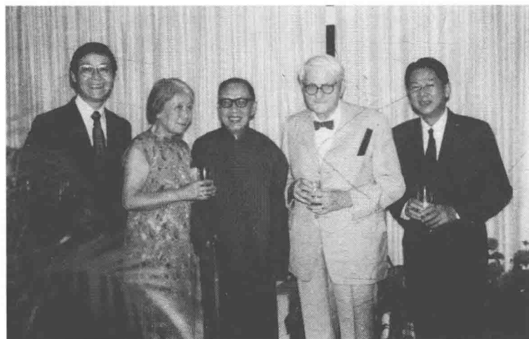
钱穆（左三）与李约瑟（左四）在香港中文大学新亚书院宴聚。鲁桂珍（左二）、马临（左五）、金耀基（左一）陪同（1979年）