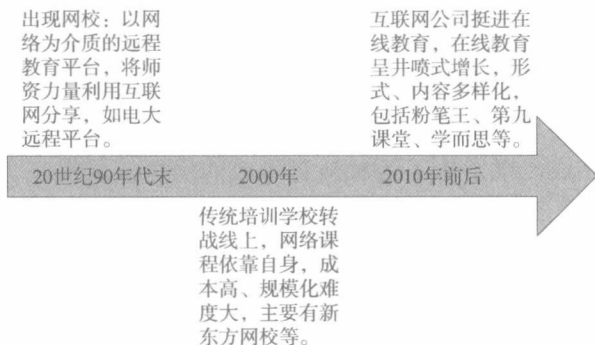
图 1-1 我国在线教育发展历程

从我国在线教育发展历程来看(图 1-1),其经历了从远程教育平台、传统培训学校转战线上到目前的互联网公司涉足三个阶段。在这一发展过程中,在线教育的形式和内容越来越多样化,便利程度也在不断提高,越来越多的消费者开始乐意尝试这种新型学习方式。据《2015 中国教育行业白皮书》调查显示,通过网络进行学历教育、职业技能培训、专业认证考试培训的需求十分旺盛。