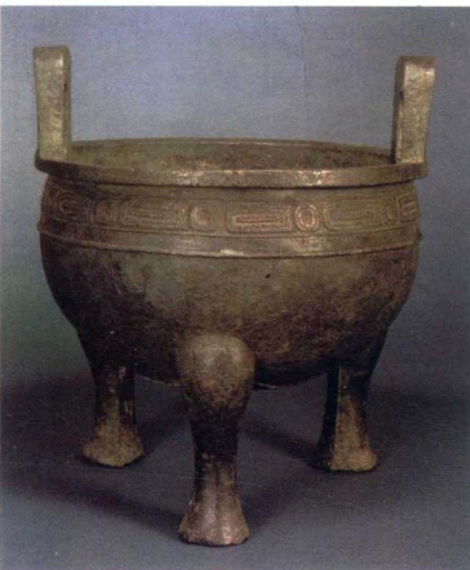
图4 毛公鼎 西周宣王 台北“故宫博物院”藏