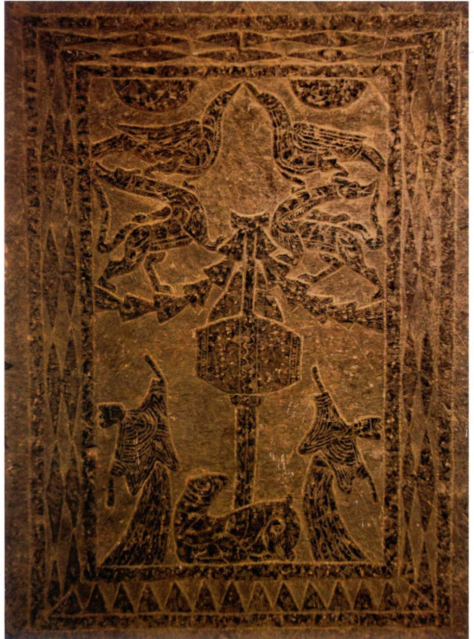
图10 击建鼓 刻石 汉 徐州汉画像石艺术馆藏