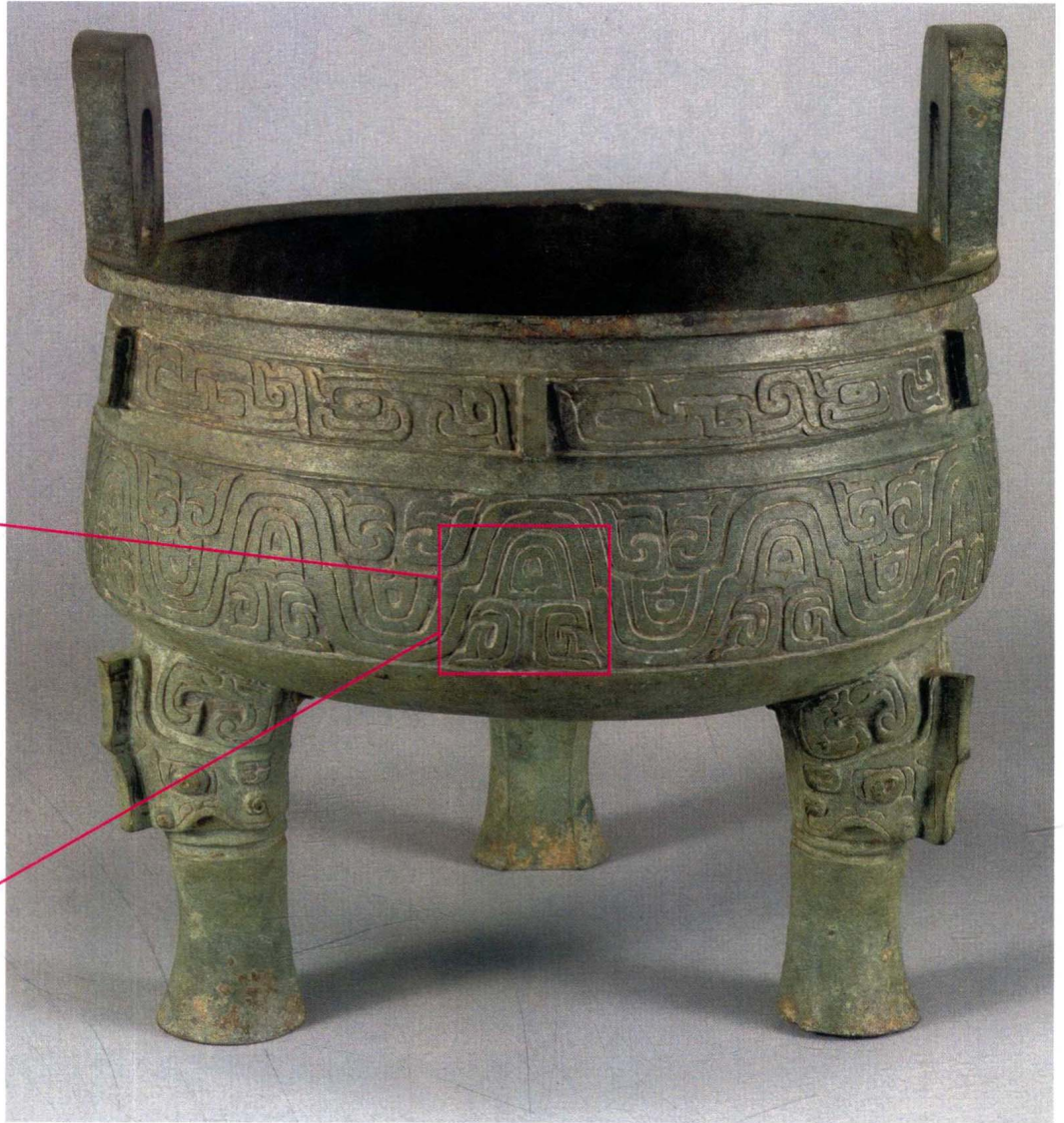
图3 史颂鼎 西周共和 上海博物馆藏