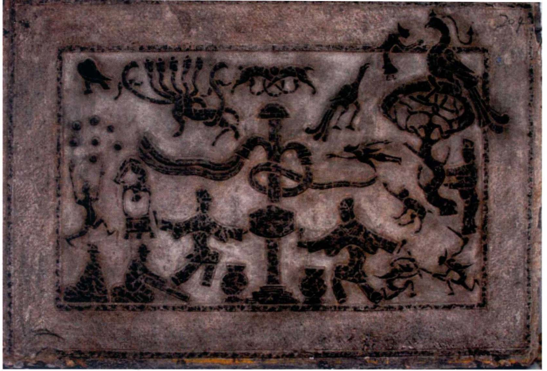
图8 击建鼓 刻石 汉 山东滕州汉画像石馆