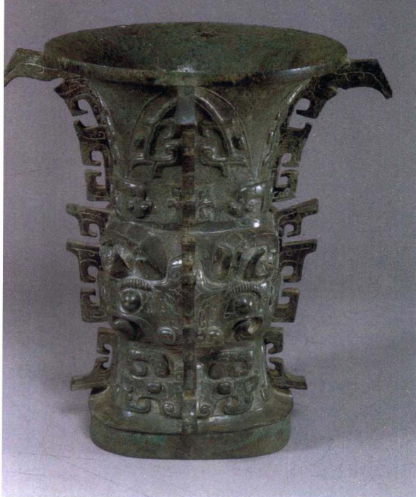
图5 何尊 宝鸡青铜器博物院藏