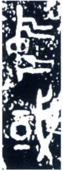
图9 何尊铭文拓片（局部）