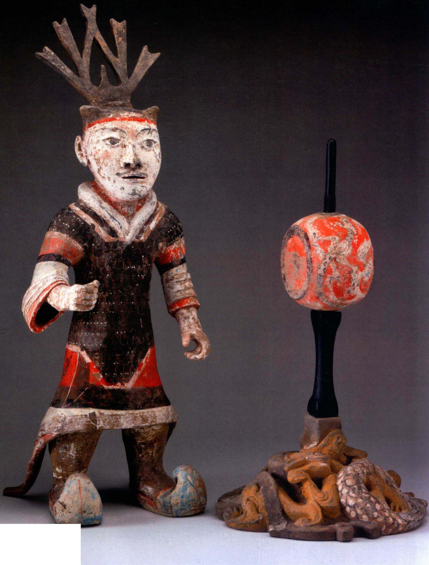
图11 建鼓俑 汉 The David W.Dewey Collection 杜唯和林喜翔收藏