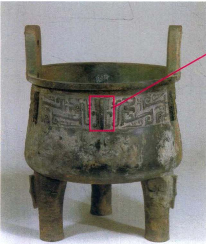
图2 外叔鼎 西周早期 陕西历史博物馆藏