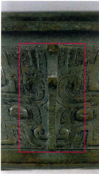
图1 德方鼎 西周成王 上海博物馆藏