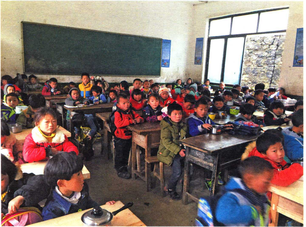
贵州毕节纳雍县乐园小学，上课中的学生们。