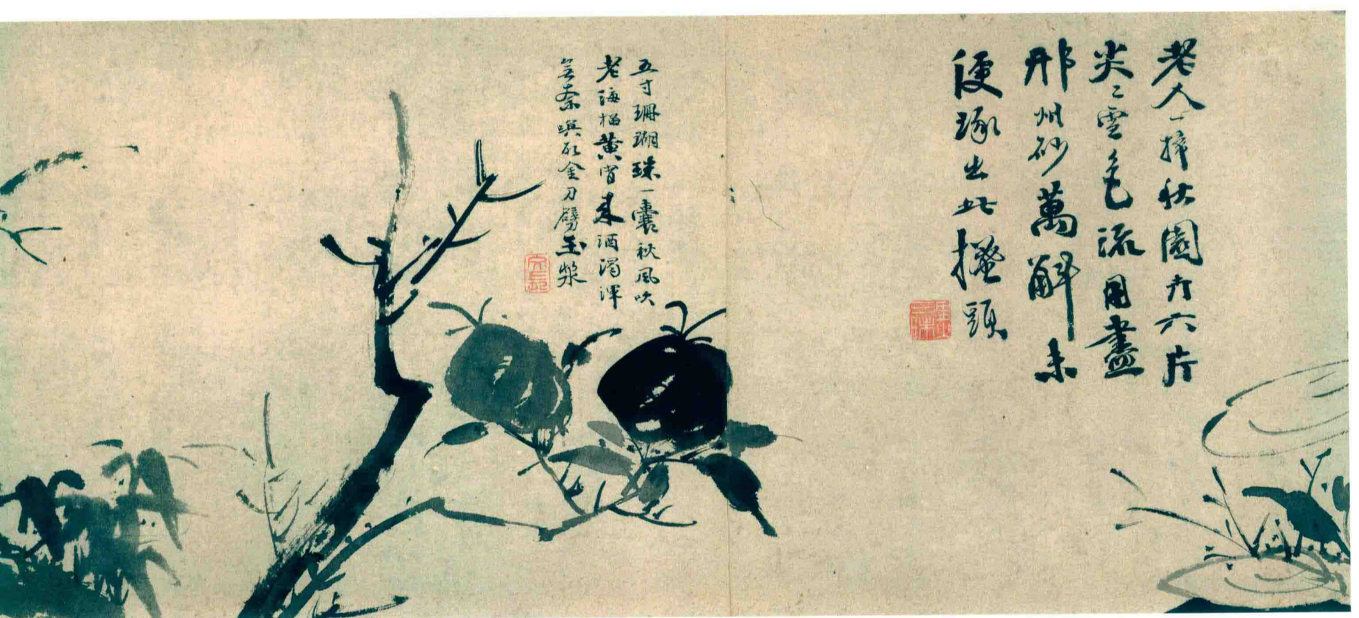
1. 明 徐 渭 花 卉 圖 (十 二 段 卷) 紙 本 水 墨 縱 32.5 厘 米 橫 622.6 厘 米 雲 南 省 博 物 館 藏

Flowers (Twelve segments) Xu Wei, Ming Dynasty Ink on paper, 32.5 cm × 622.6 cm Yunnan Provincial Museum