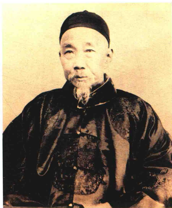
曾祖父奎俊，任四川总督、西安巡抚，内务府大臣， 组建四川通省大学堂