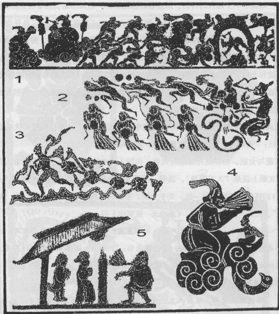
图2 ● 神话中的自然之神（汉代画像石）

日月轮回，运转不息；更多的画面是分别手持规（圆规）、矩（角尺），所谓“不以规矩不能成方圆”，不但象征着“天圆地方”，同时也表示对神州的完美设计。用规矩作