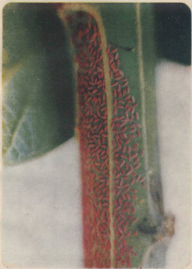
图版 1:1 紫胶虫幼虫在寄主植物上固定