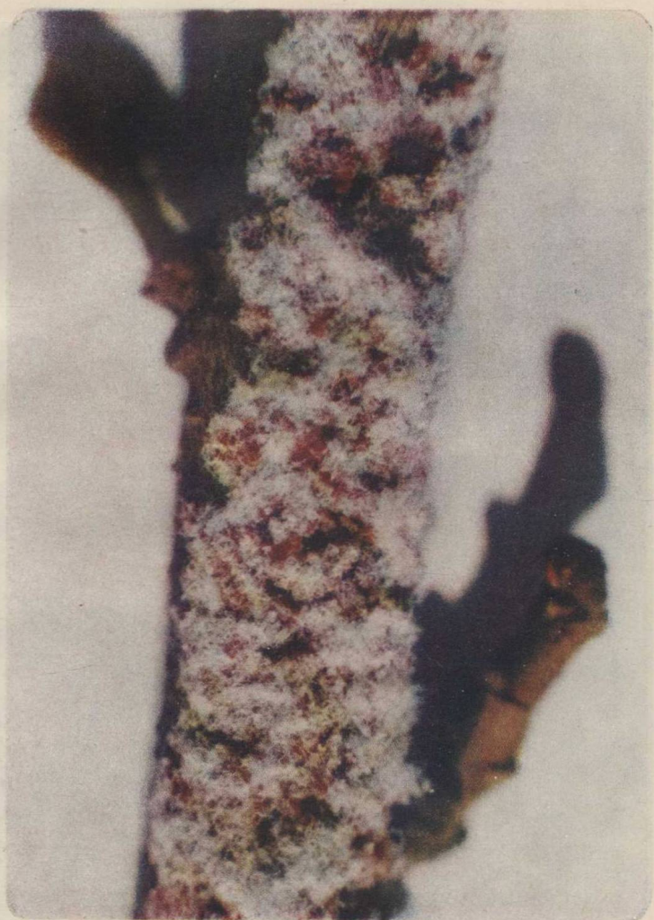
图版 1:3 紫胶虫雌幼虫分泌的胶质和蜡丝