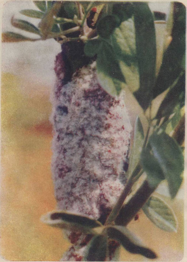
图版 1:4 紫胶虫雌成虫分泌胶质形成的胶被