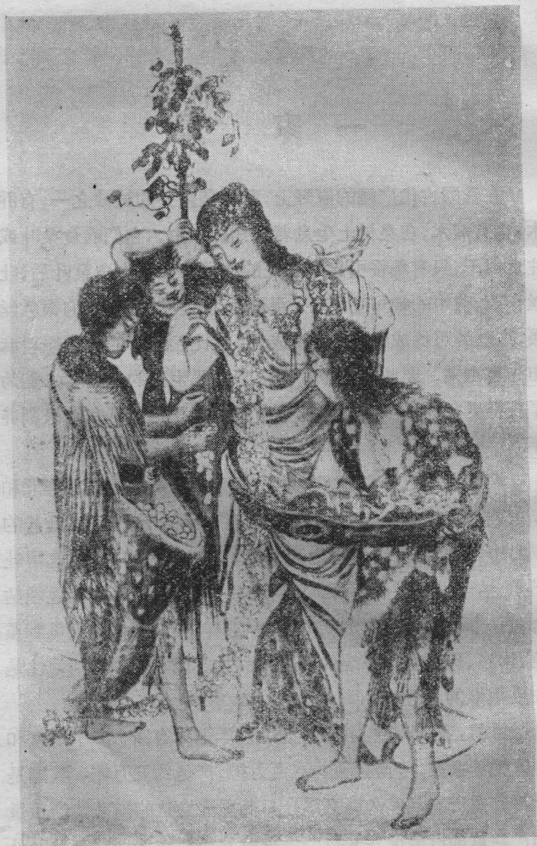
我国古代人民驯化家蚕设想图