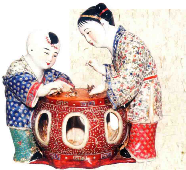
粉彩斗蟋蟀摆件（清代）