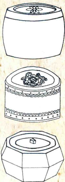
古籍中的南盆图谱

苏州若没有“秋兴”这一拨蟋蟀盆的真正的“好白相的玩家”，便会与中国玩虫中心的地位失之交臂，“南盆”也就牛不起来了。