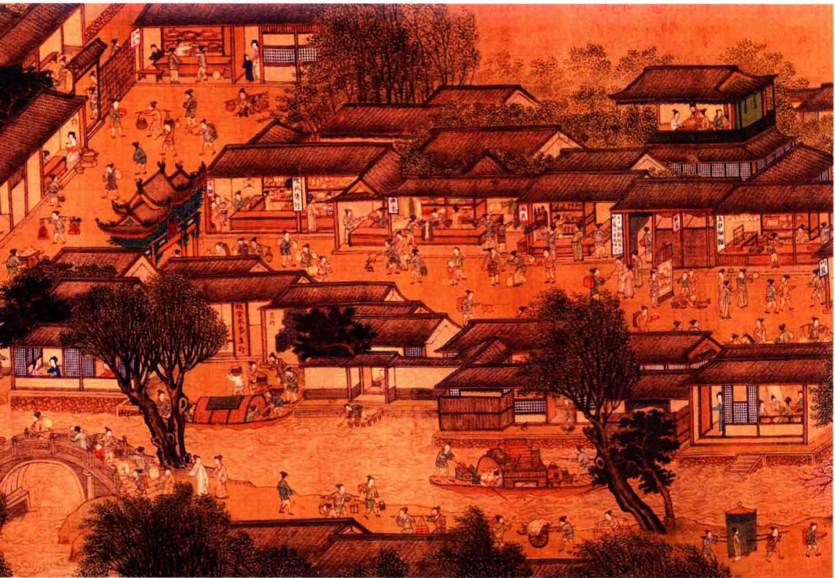
仇英版《清明上河图》以明代苏州城为背景，描绘了明代苏州城繁华的市井生活，是明朝苏州风情的缩影（辽宁省博物馆藏）

城市网络？因为相比之下，工艺美术是苏州真正的强项，其不是后发的，而是苏州最具传统的东西。