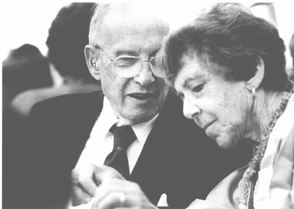
彼得·德鲁克和妻子多丽丝·德鲁克