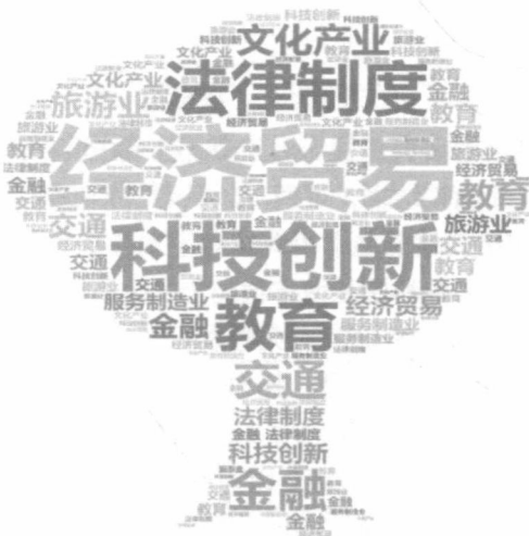
图2 粤港澳研究文献集中效度图

制度领域、金融领域交通领域、教育领域、服务制造业领域、旅游业领域等（见图2），以经济、科技创新、法律制度的研究文献居多。学者对粤港澳大湾区的内涵、建设意义、发展优势与挑战，以及具体到各个行业的协同发展的研究均已取得较好成效，成果显著。