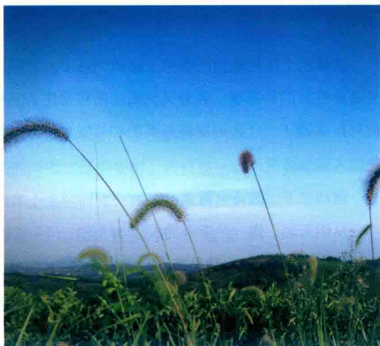
1 | 2 1. 蓝天、白云、茶园 2. 悠然见太姥山