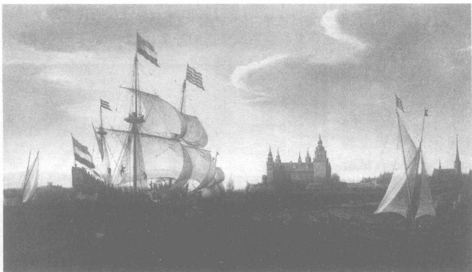
荷兰商船经过松德海峡

其次,从地缘角度看,瑞典也是相当不安全的,当时的丹麦(严格来说是丹麦-挪威联合王国)与瑞典有着漫长的边界线,除了一段狭窄的出海口外,瑞典面向北海和大西洋的窗口几乎全被堵死。如果它想在波罗的海以外开展贸易,松德海峡几乎是必经之路,而丹麦在海峡两侧都拥有领土,可以坐收“买路钱”,让瑞典苦不堪言。丹麦还据有瑞典东南沿海的哥得兰岛和爱沙尼亚西南沿海的奥塞尔岛,两岛就像两块巨石,阻碍了瑞典的海上行动。斯堪的纳维亚半岛最南部(包括斯堪尼亚、哈兰、布莱金厄等省)当时也是丹麦的领土,而挪威的耶姆特兰和海里耶达伦两省超过了斯堪的纳维亚山脉的分水岭,使瑞典本土很容易被切断为南北两部分。