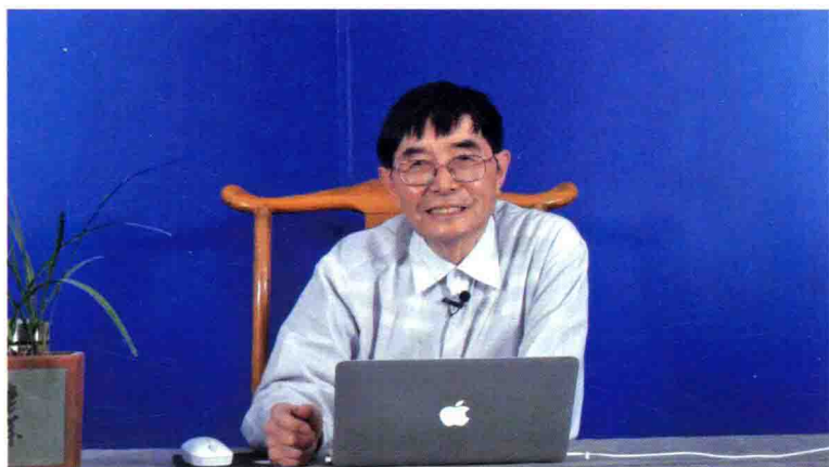
姜先生在《65条学完一本〈伤寒论〉》课程录制现场 (2018年10月25日于北京)