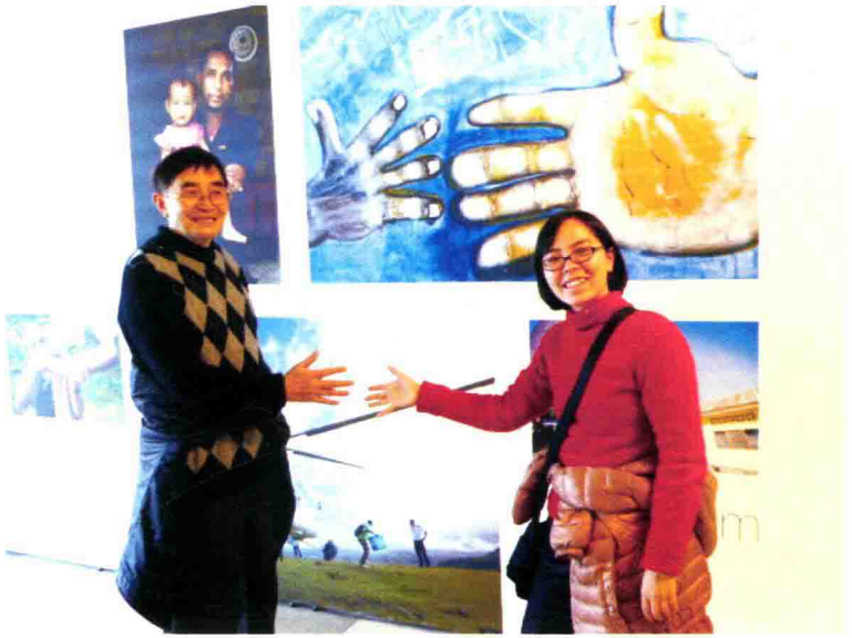
姜氏父女在美国联合国总部合影（2012年12月7日）