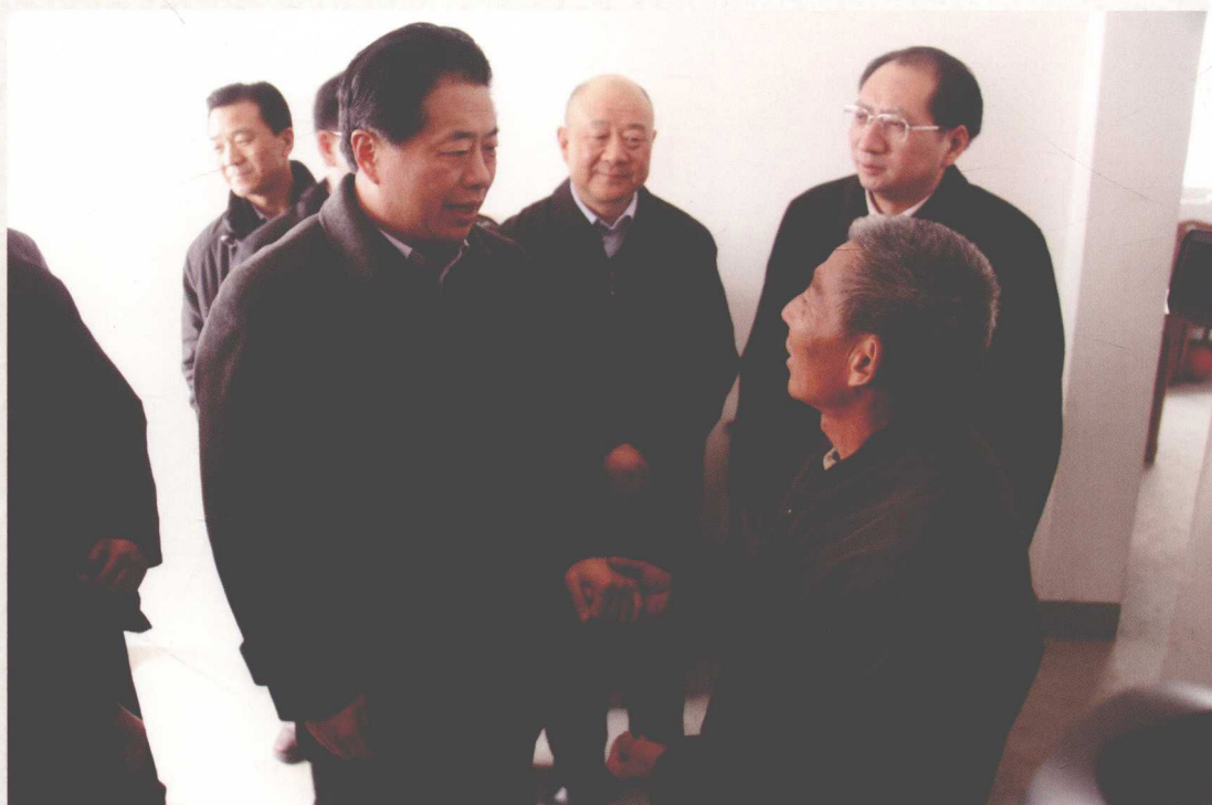
2011年11月，国务院南水北调办主任鄂竟平（右四）到十堰市郧阳区谭家湾镇十方院移民安置点看望慰问移民