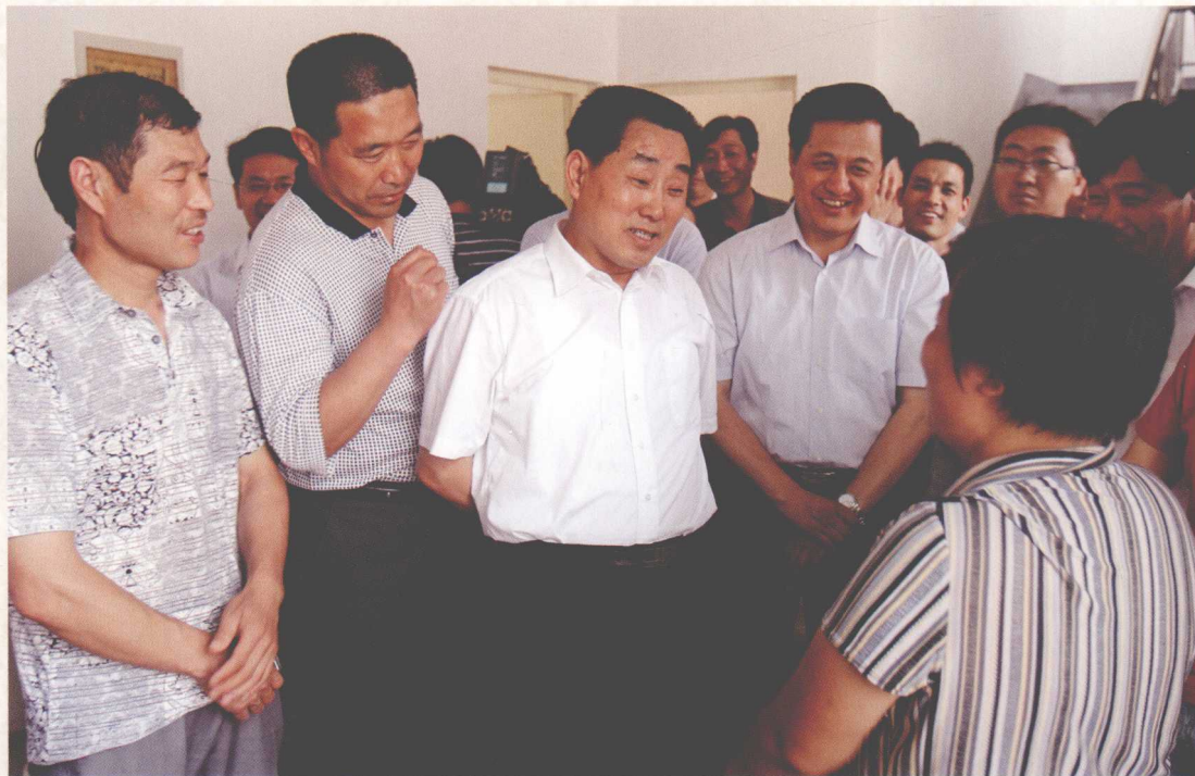
2011年6月，河南省副省长刘满仓（左三）在荥阳市广武镇丹阳移民新村看望刚搬迁来的移民群众