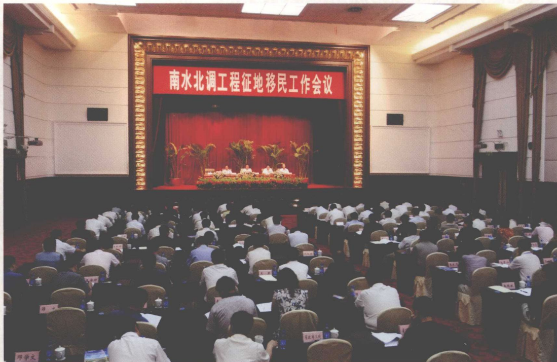
2008年6月，国务院南水北调办在郑州市召开南水北调工程征地移民工作会议