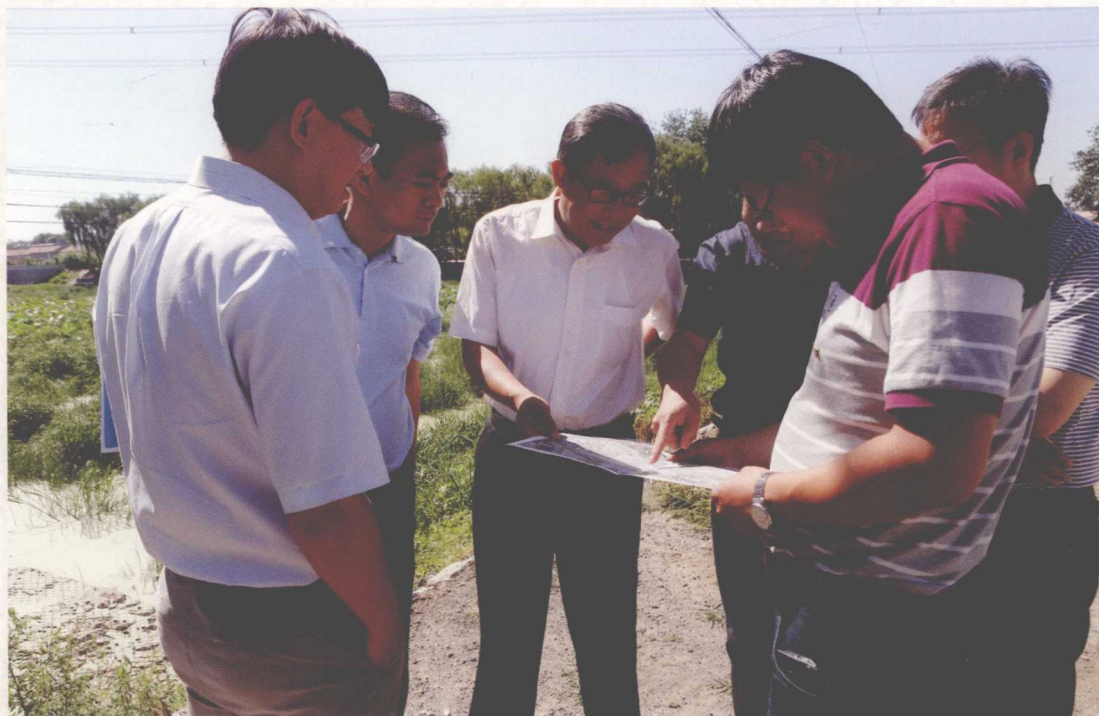
2015年7月，北京市南水北调办主任孙国升（左三）视察通州支线工程