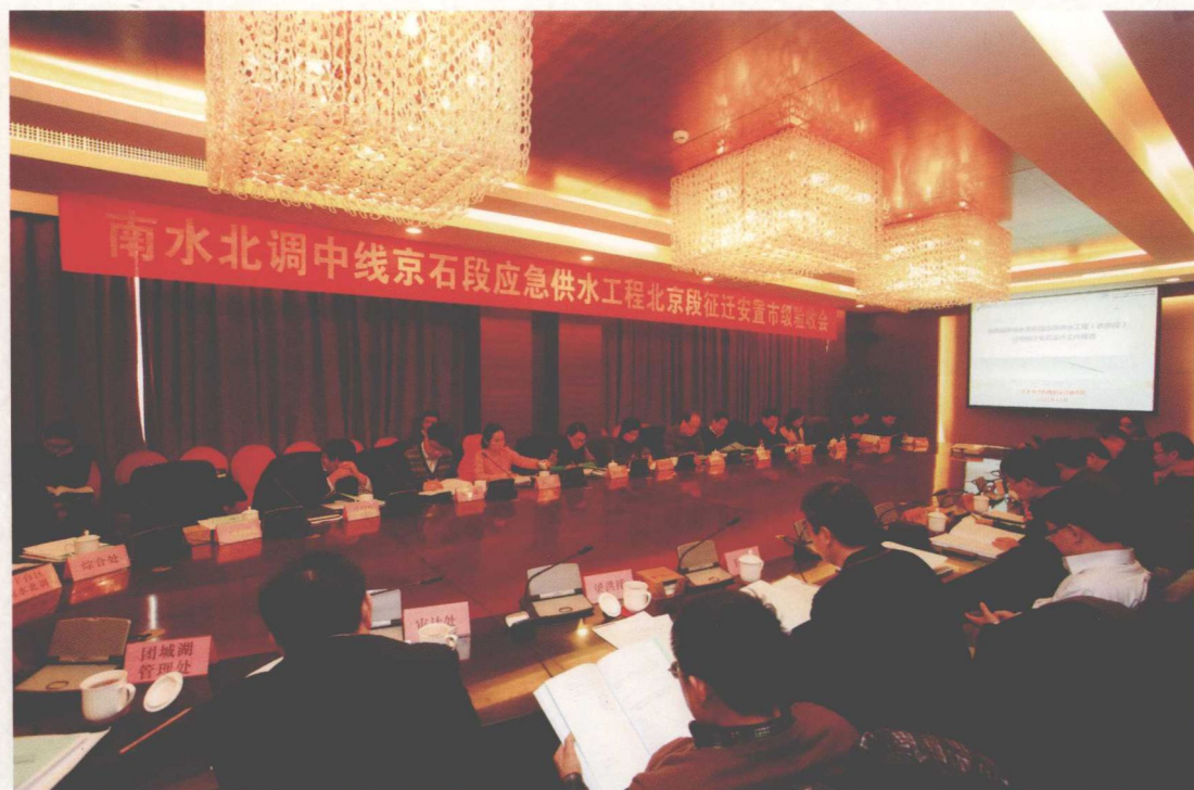
2015年12月，北京市南水北调办组织召开征迁安置市级验收会