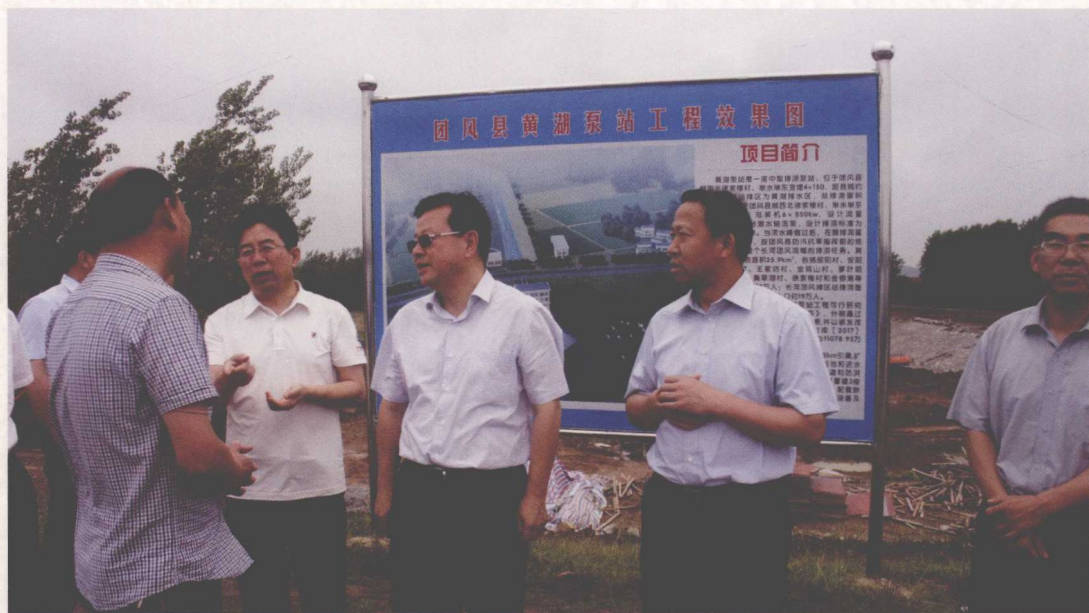
2017年6月，国务院南水北调办副主任蒋旭光（右三）到湖北省团风县调研移民灾后重建情况