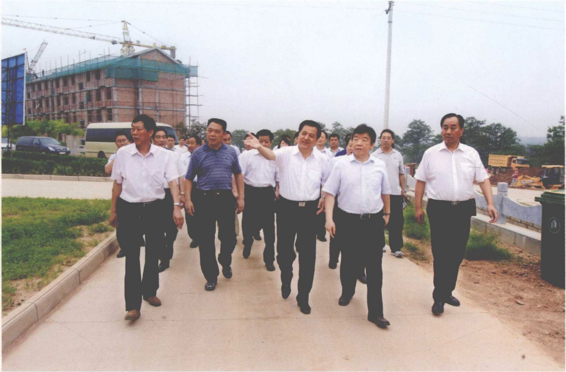
2010年9月，河南省委书记卢展工（前排右二）在新乡辉县市常村镇常春社区调研丹江口库区移民安置工作