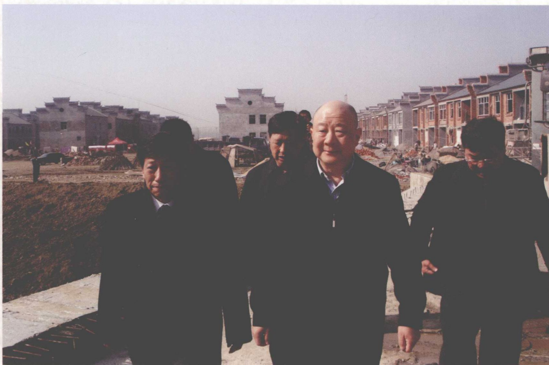
2009年11月，湖北省副省长田承忠（右二）视察兴隆水利枢纽工程潜江市高石碑镇沿堤新村安置点