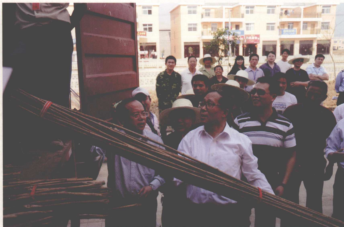
2010年5月，湖北省省长李鸿忠（左二）帮助移民搬迁