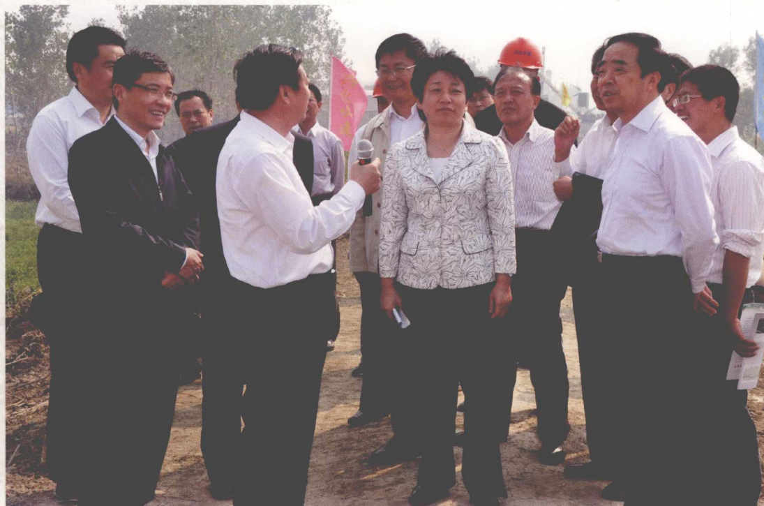
2011年4月，江苏省委常委、副省长黄莉新（前中）现场查看南水北调工程征迁安置工作