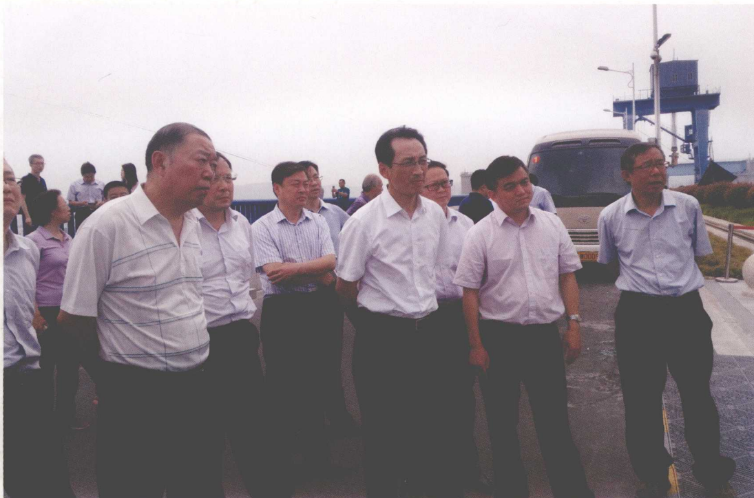
2017年7月，国务院南水北调办副主任陈刚（右四）调研十堰市丹江口水库对口协作工作