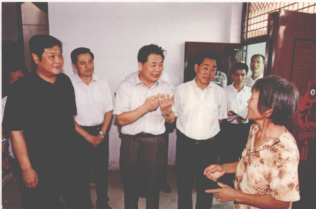
2010年8月，国务院南水北调办主任鄂竟平（左四）在郑州市中牟县姚湾移民试点新村调研