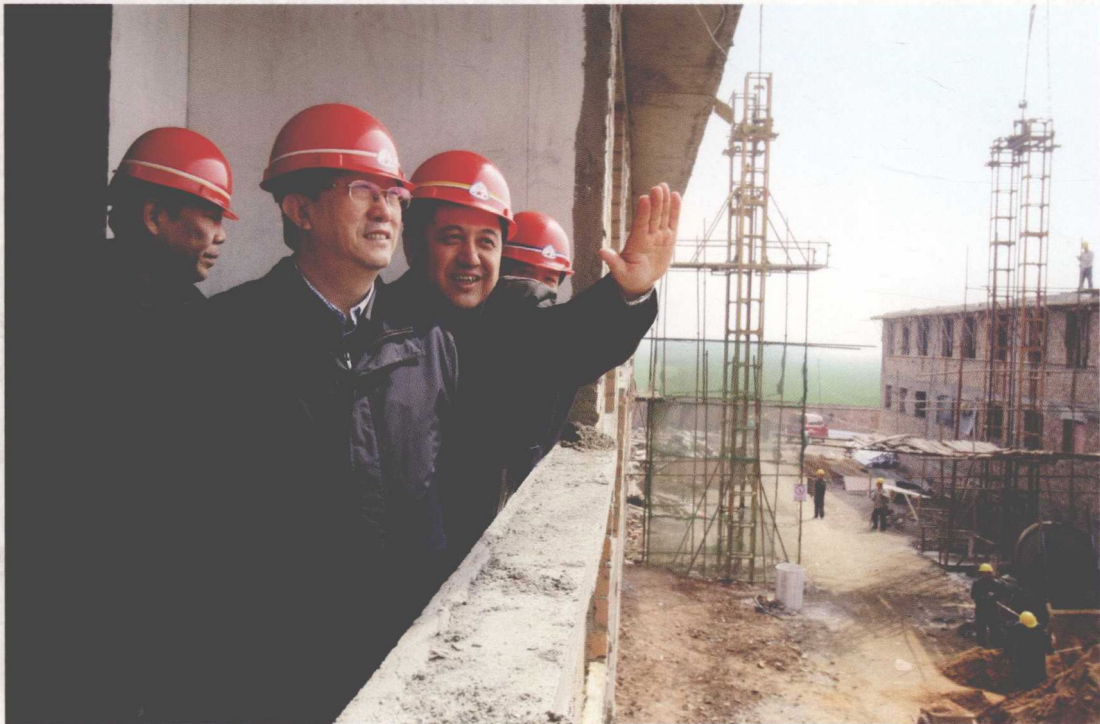
2010年3月，河南省省长郭庚茂（左二）到平顶山市宝丰县柳沟营村调研第一批移民新村建设