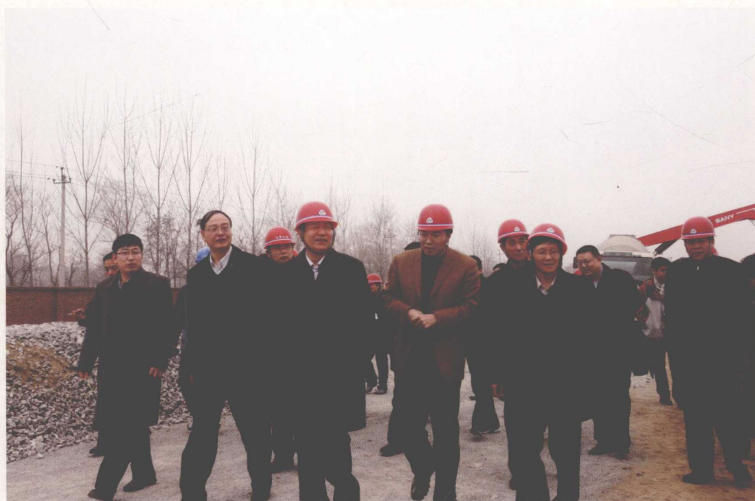
2009年3月，天津市副市长李文喜（左三）视察天津干线征迁及施工现场