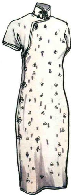
图1-4 (e) 20世纪30年代紫色拷花丝绒旗袍 图1-4 (f) 20世纪30年代浅黄小花纹绉短袖旗袍