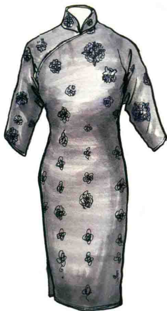
图1-4 (g) 20世纪40年代花卉纹印花旗袍 图1-4 (h) 20世纪40年代印花绸长袖旗袍