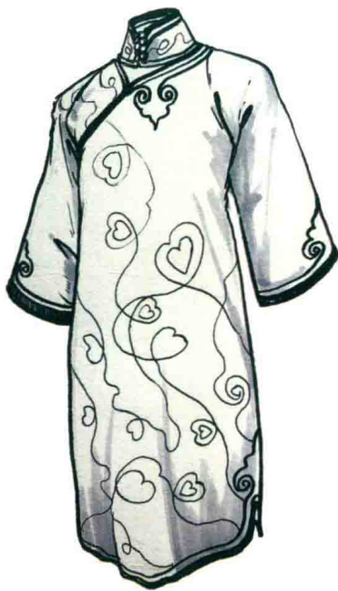
图1-4 (b) 20世纪20年代卷云纹倒大袖旗袍