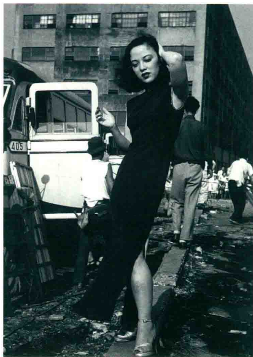
图1-2 1952年 李香兰

发展到民国时期，旗袍的腰身开始向内收，整体线条凹凸有致，使其贴合身体，而且造型纤长，与当时西方流行的女装廓形相吻合，展现出女性曼妙的身姿。旗袍袍身的图案类型也十分丰富，从简至繁，有的无半点装饰，尽显简洁朴素之美（图 1-2）；有的花纹层叠繁复，却毫无俗气可言（图 1-3）。