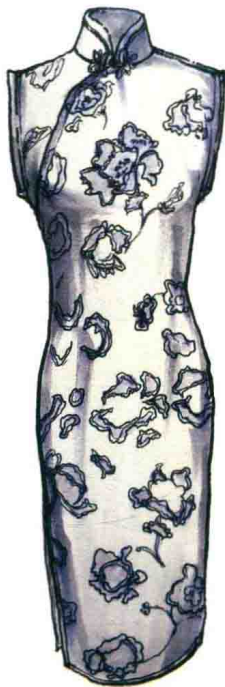
图1-4 (d) 20世纪30年代无袖旗袍