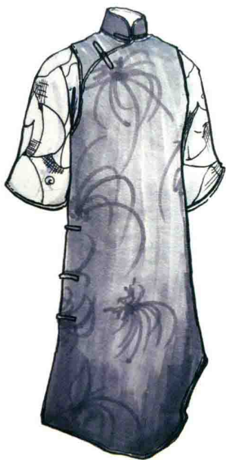
图1-4 (a) 倒大袖旗袍马甲