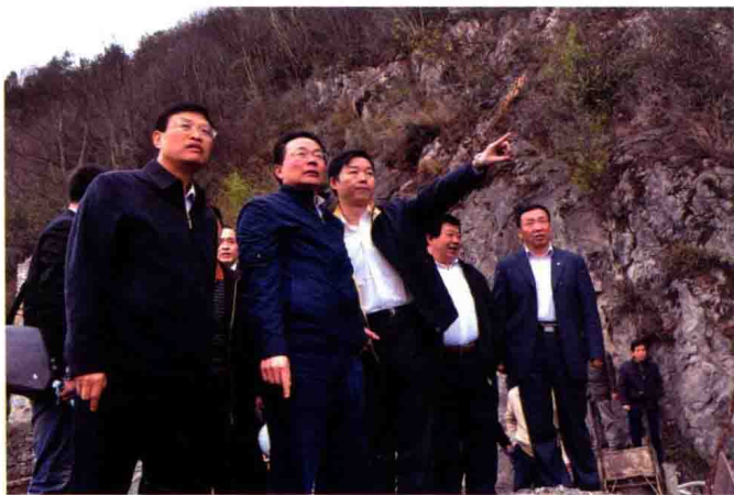
2010年4月，中国农业发展银行行长郑晖（左二）在毕节地区实地考察倒天河流域综合治理项目