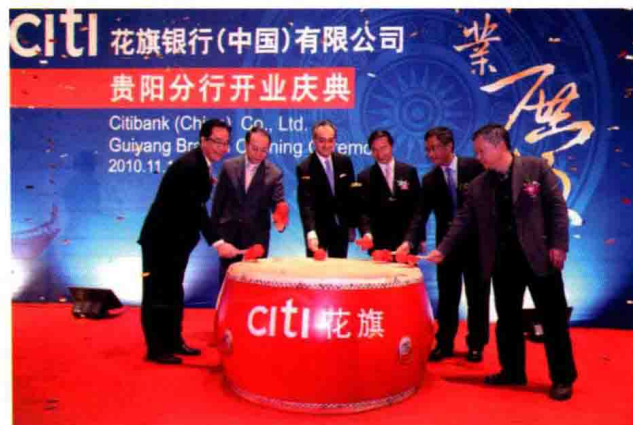
2010年11月12日，花旗银行贵阳分行开业，这是省内设立的首个国外银行分支机构