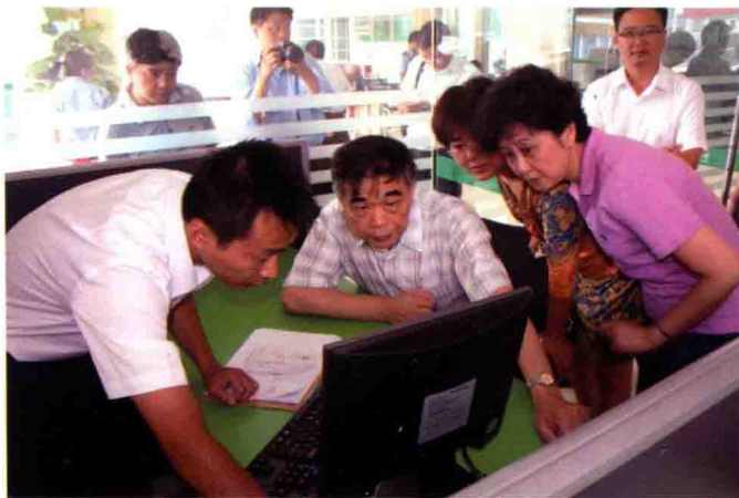
2010年8月24日，中国人民银行行长助理李东荣（左二）到黔南州荔波县就农村金融服务需求情况开展调研