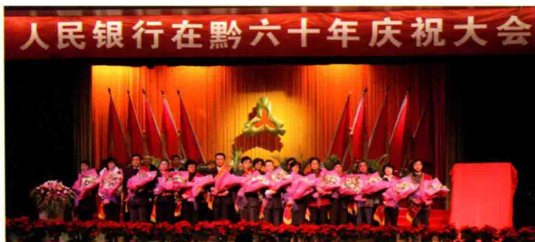
2009年12月16日，人行贵阳中心支行召开人民银行在贵州省设立派出机构60年庆祝大会并表彰先进员工