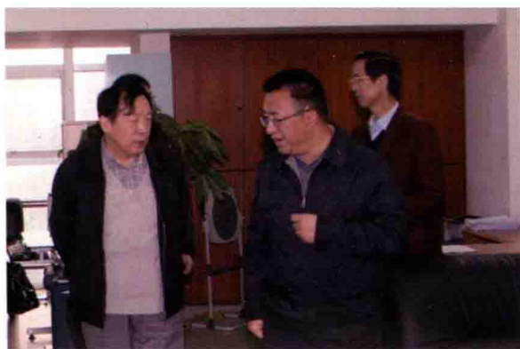
2009年11月，中国保监会副主席魏迎宁（左）在贵州保监局视察指导工作