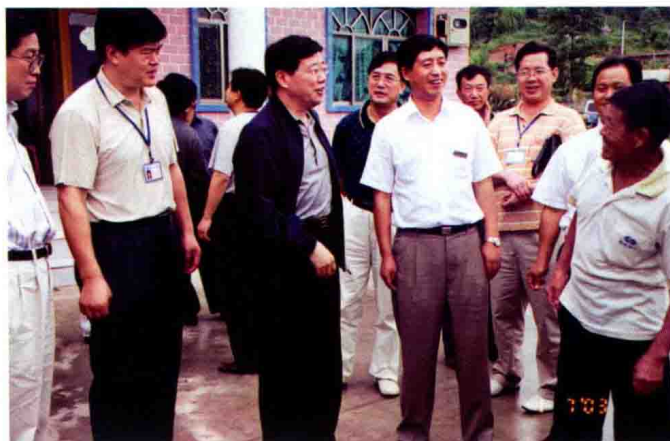
2003年7月1日，中国银监会副主席李伟（左二）到花溪农信社调研