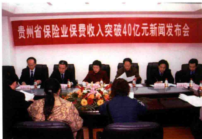
2005年末，全省保险业保费收入突破40亿元，贵州保监局组织召开新闻发布会