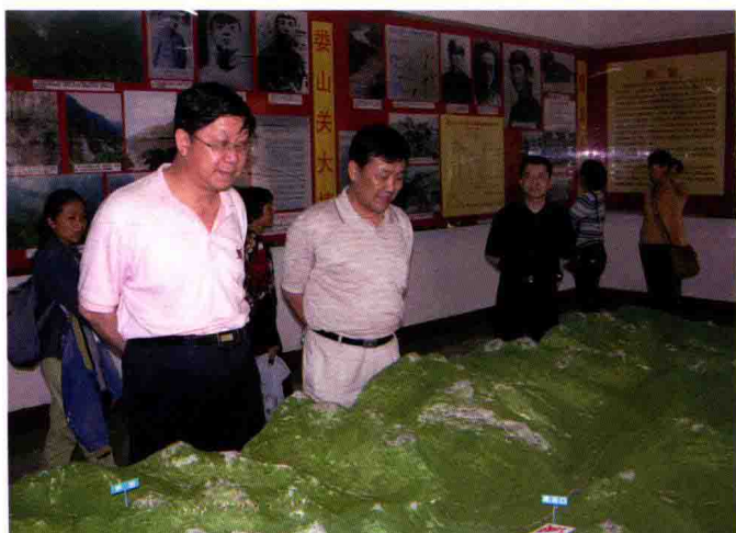
2005年5月，中国银监会副主席唐双林（左）到遵义银监局考察并参观中国工农红军纪念馆