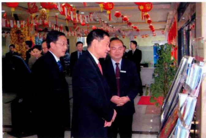
2007年2月7日，中国银行董事长肖钢（中）视察中行贵阳市甲秀支行