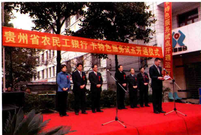
2005年12月，人民银行副行长苏宁在贵州省农民工银行卡特色服务试点开通仪式上讲话