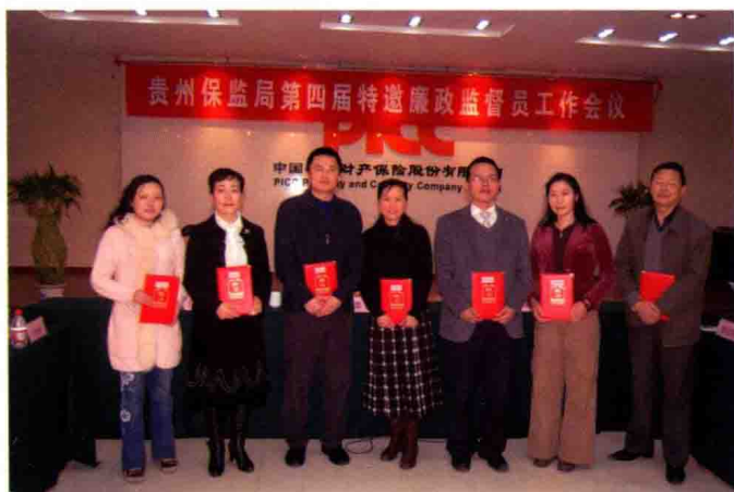
2009年4月3日，贵州保监局在第四届特邀廉政监督员工作会议对特邀廉政监督员颁发聘任书