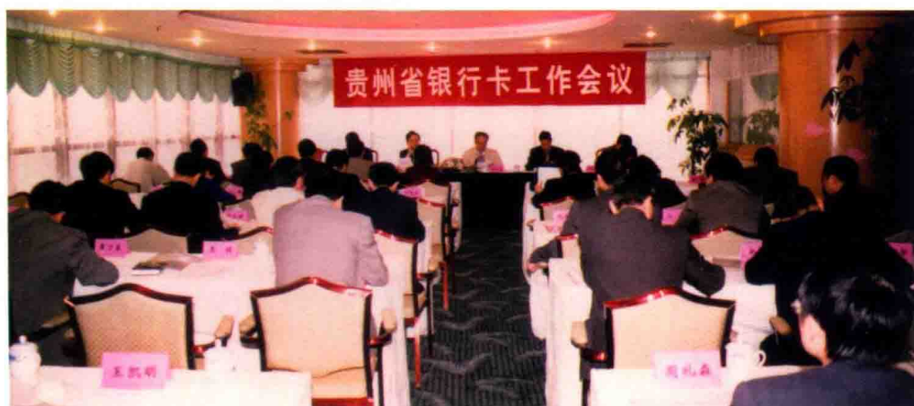
2001年4月15日，人行贵阳中心支行召开全省银行卡工作会议，协调和促进银行卡业务发展