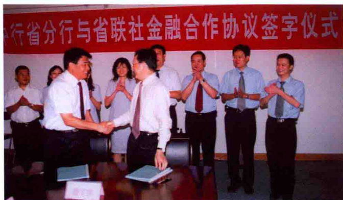
2006年，中行省分行与省农信联社签订金融合作协议，中行为联社提供信用和结算支持