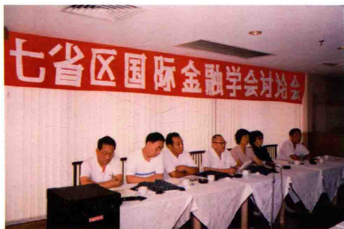
1990年8月，中国银行贵州省分行主持召开南方片区七省区国际金融学会讨论会