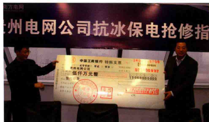
2007年5月3日，人保财险贵州省分公司向贵州电网公司预付赔款5000万元