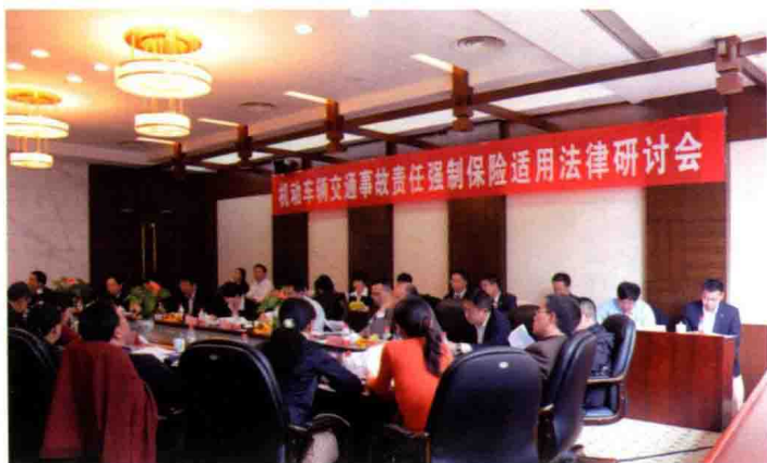
2010年10月，贵州保监局与贵州省高级人民法院联合举行机动车交通事故责任强制保险适用法律研讨会