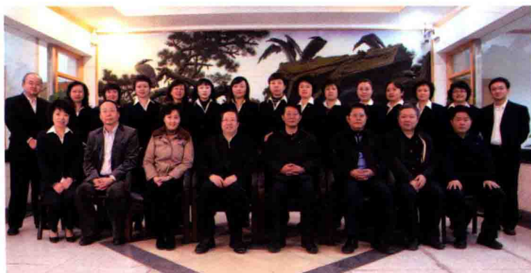
2009年年末，副省长王晓东（前排左四）到人行贵阳中心支行慰问进行年终结算的职工