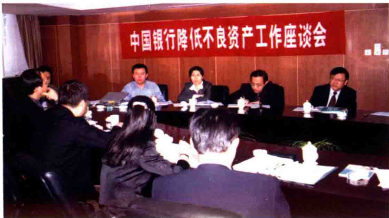
2001年8月，中行省分行召开降低不良资产工作座谈会