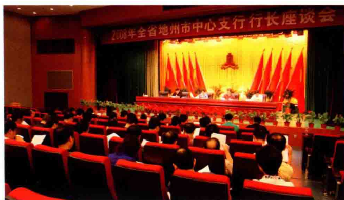
2008年8月，人民银行召开全省地（州、市）中心支行行长座谈会