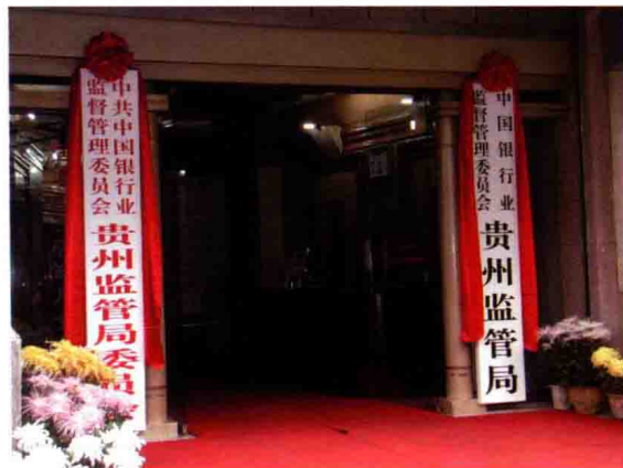
2003年10月16日，贵州银监局正式挂牌成立