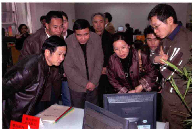
2006年2月15日，全省税、库、银横向联网试点成功，实现税款实时划缴和及时入库