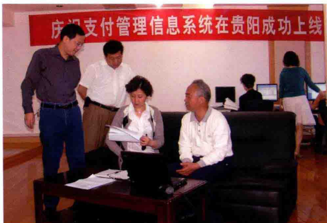
2003年12月1日，人民银行支付系统贵阳城市处理中心建成投产，大额实时支付系统在贵阳地区切换上线成功运行