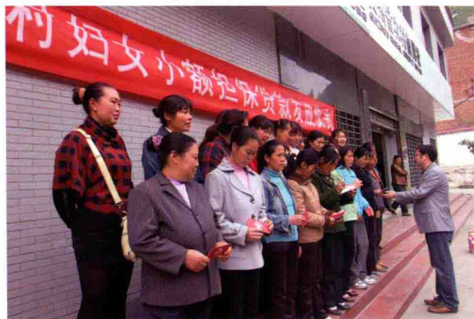
2006年，全省农村信用社专门推出农村妇女小额担保贷款。图为1月1日赫章农信联社举行贷款发放仪式