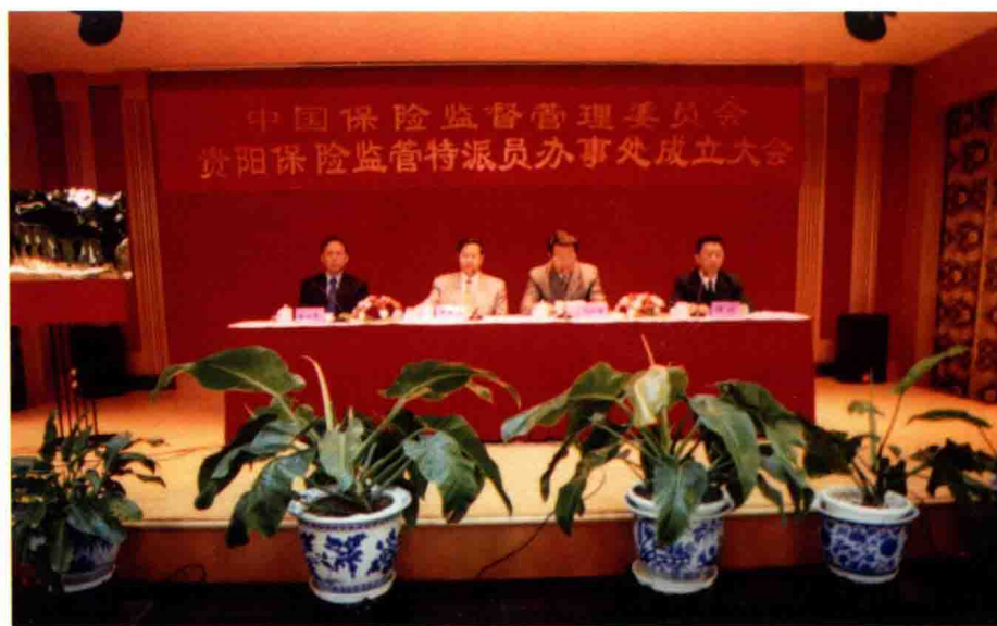
2000年9月18日，中国保险监督管理委员会贵阳保险监管特派员办事处成立