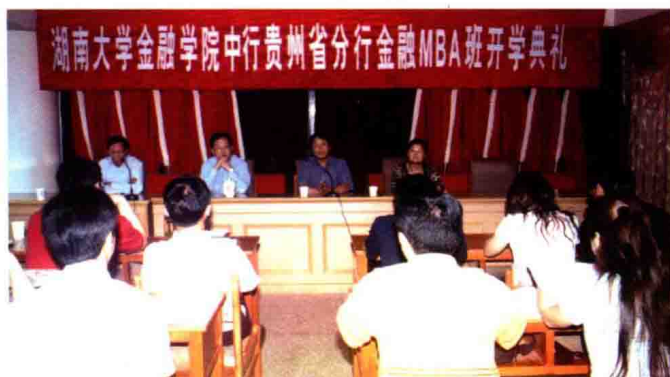
2004年，中行贵州省分行与湖南大学金融学院联办金融MBA班