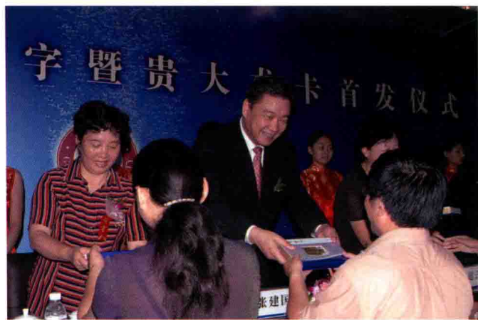
2006年8月29日，中国建设银行行长张建国（左二）出席建行贵州省分行与贵州大学银校合作协议签字暨“贵大龙卡”首发仪式