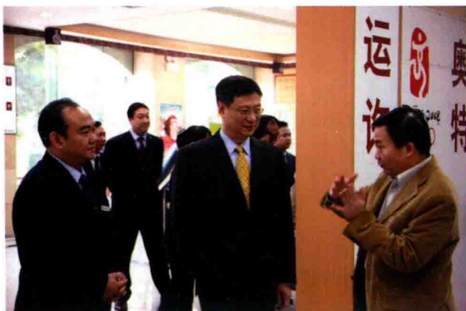
2007年9月，中国银行行长李礼辉（中）在中行贵州省分行进行工作调研