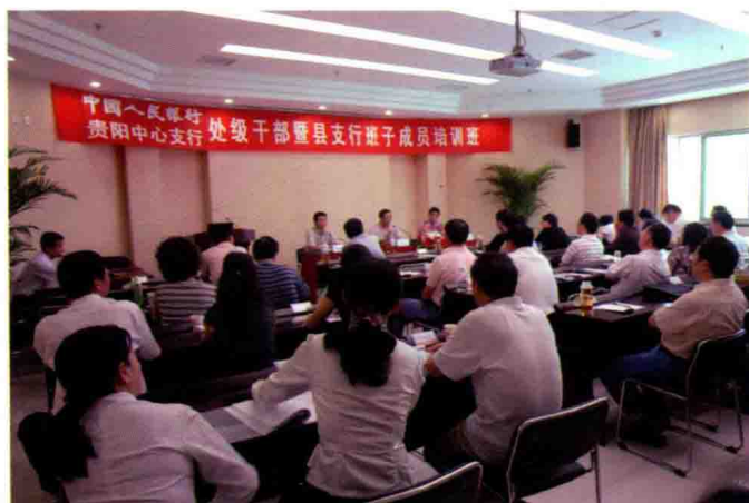
2009年5月，人行贵阳中心支行在郑州金融培训学院举办处级干部暨县支行班子全体成员培训班