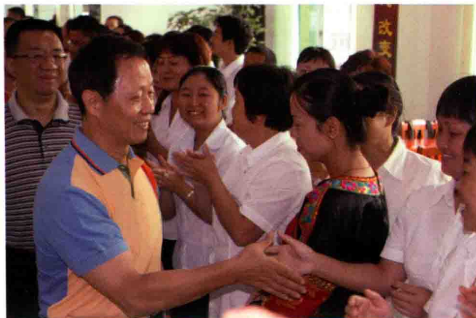
2009年9月，中国保监会主席吴定富（前左）到贵州省黔东南检查指导工作并探望基层保险从业人员