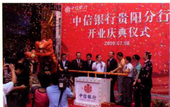
2009年7月8日，中信银行行长陈小宪（右五）和省委常委、副省长王晓东（右六）为中信银行贵阳分行开业揭幕。该行为改革开放后省内首次引进设立的全国性股份制商业银行分支机构