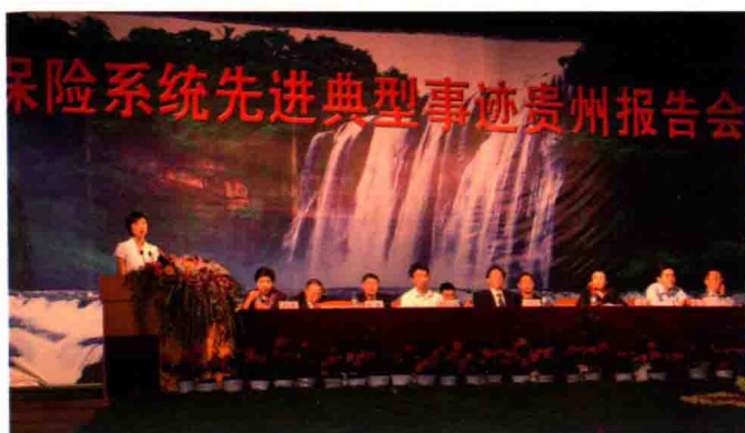
2007年，保险系统先进典型事迹报告会在贵阳举行