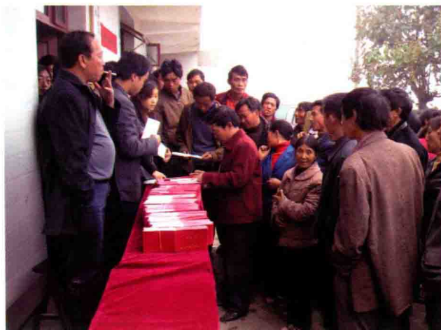
2000年，全省农村信用社全面推广农户小额信用贷款“资信卡”，着重解决农民贷款难的问题。图为贷款证发放现场