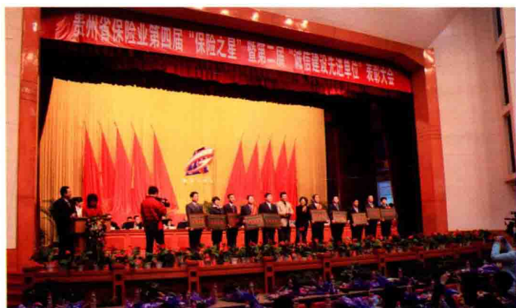
2009年12月20日贵州省保险行业举行表彰大会，表彰全省108名保险之星和20家诚信建设先进单位