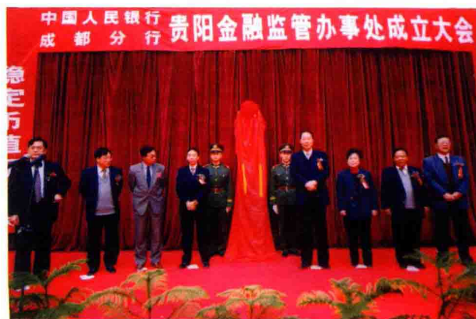
1998年12月15日，人民银行成都分行贵阳金融监管办事处成立