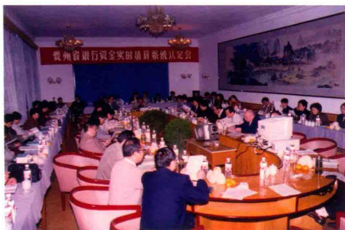
1997年，人民银行省内系统实现联行资金清算电子化。图为1月20日人行省分行在安顺召开银行资金实时清算系统认定会