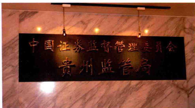
2004年3月1日，中国证券监督管理委员会贵阳证券监管特派员办事处升格为中国证券监督管理委员会贵州监管局