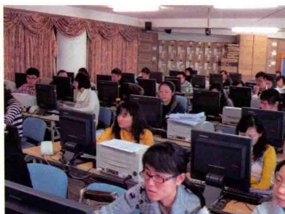
2009年，中行省分行以IT蓝图建设、网点转型为契机，加强技能操作类员工的培训