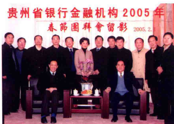
2005年2月，省长石秀诗（前排右）、副省长包克辛（前排左）会见出席全省银行业金融机构春节团拜会的各机构负责人