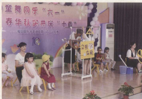
礼仪情景剧《文明车厢》