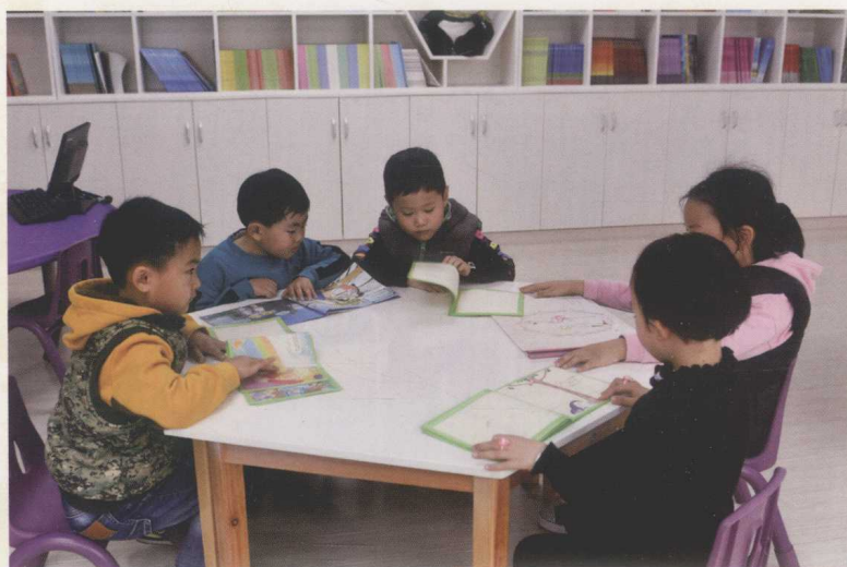
自制礼仪书大家看