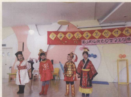
礼仪情景剧《花木兰》