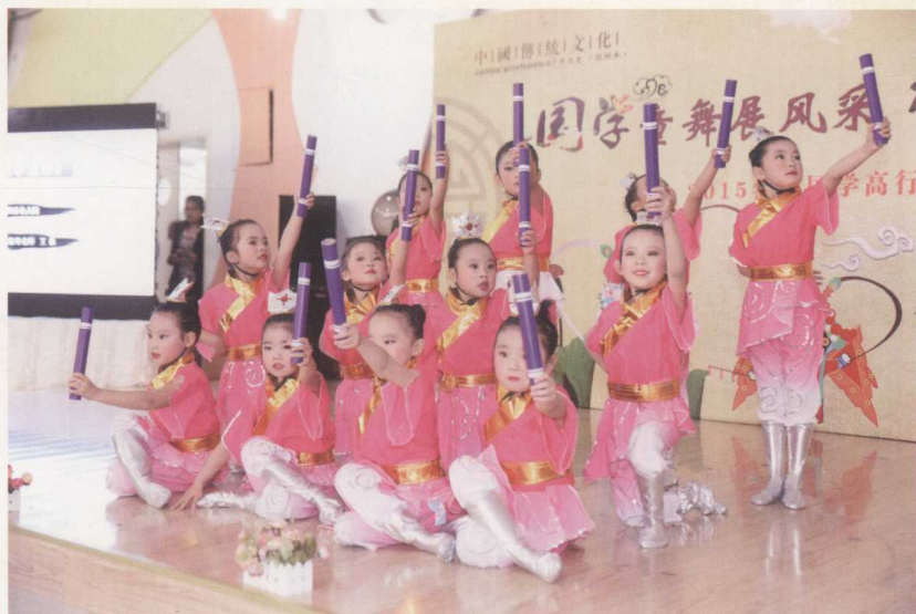
丰富多彩的园部礼仪活动