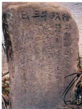
彝族：有着数百年历史的 古老封山碑