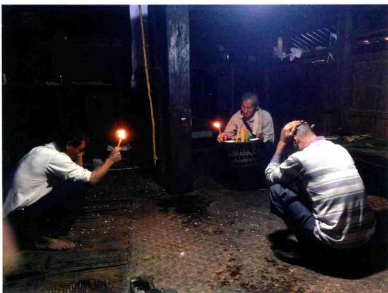
过新年大魔巴在寨主家念经祈福