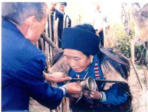
彝族：毕摩举行治病仪式