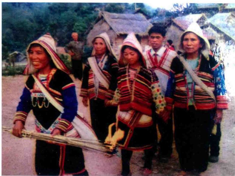
“直过”民族基诺族：婚礼迎娶新娘