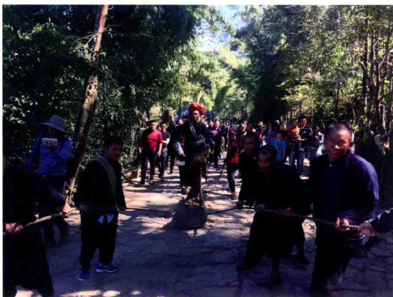
佤族传统盛大祭祀——拉木鼓