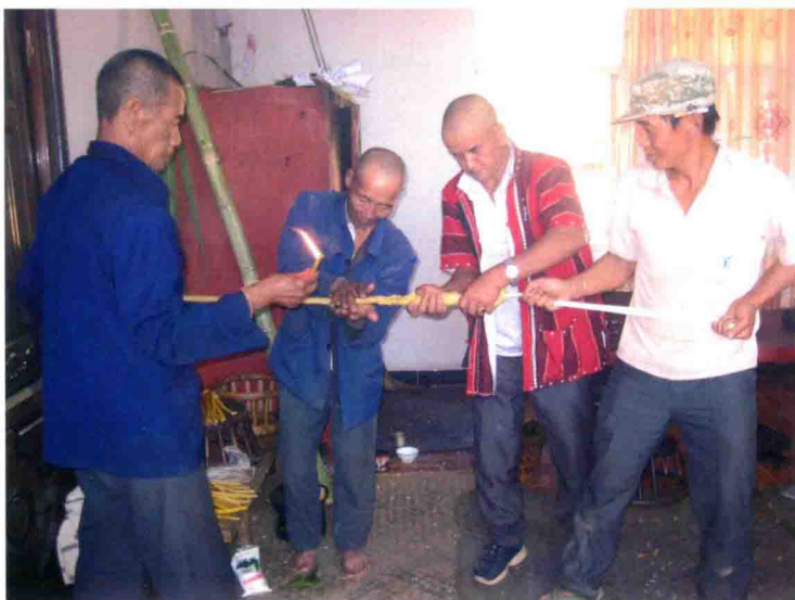
过新年时寨主和魔巴等把每家每户送来的线、蜡烛拧成一股以长线做芯的长蜡烛条，代表全寨人团结一心