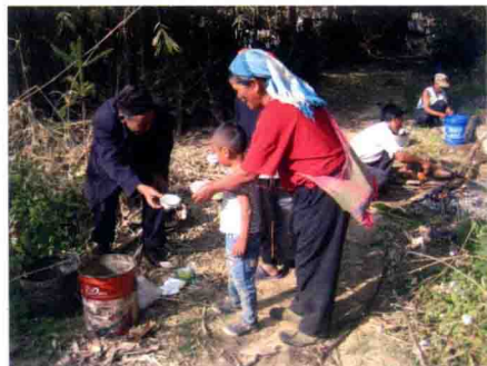
新年取新火仪式上，每家每户送毛线、米和谷给魔巴，祈愿丰衣足食