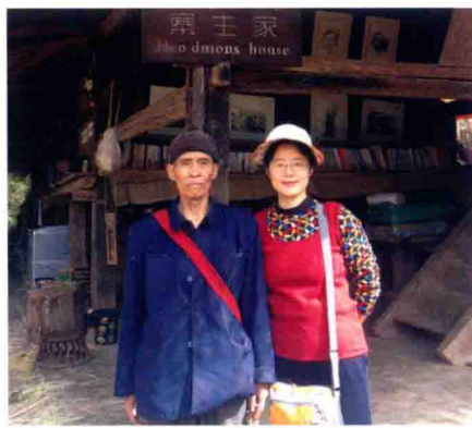
笔者与寨主的弟弟在寨主家门口合影