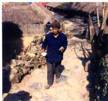
过新年每家每户送蜡烛、米、米花、粑粑给寨主