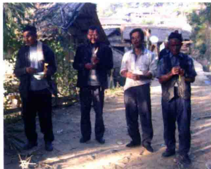
魔巴在取火处念经祈福