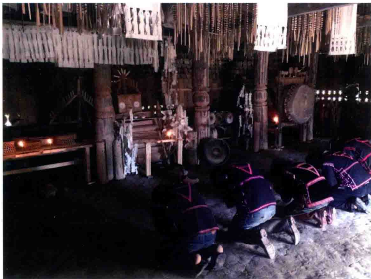
从糯卡达门祭祀回来的小伙在佛堂点蜡祭拜