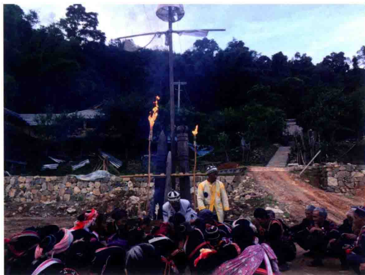
拉祜西火把节祭祀仪式之一：村民为佛爷和卓巴洗手