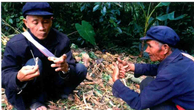
火把节前头人杀鸡看卦