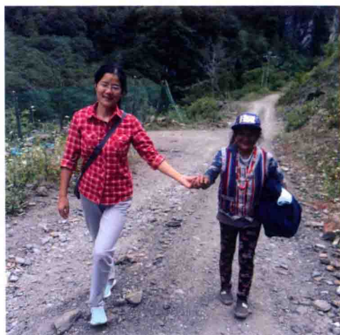
图4 “直过”民族独龙族（文面老人）