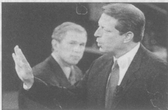
小布什与戈尔辩论

什和戈尔交替领先，难分伯仲。但到了佛罗里达州，情况突变。2000年11月7日总统大选日当天，佛罗里达州选举委员会宣布，小布什获得的选民票（又称普选票，popular vote）占该州67个县选民票的48.8%，比戈尔多1784票，小布什获胜。戈尔当即承认败选，并向小布什打电话祝贺他当选。美国各州对总统选举有自己的选举法。依据佛罗里达州选举法，胜利的幅度低于已投票数的0.5%，必须重新计票（当时小布什比戈尔多1784票，占该州选民票总数的0.0299%）。当戈尔及时被告知这一规定后，立即振作起来，撤销败选声明，要求重新计票。于是一场延续了30多天的重新计票之争开始了。争论的焦点表面看是用“自动机器重新计票”（automatic machine recount）还是用人工重新计票（a manual recount）之争，实质是选票之争。11月10日，佛罗里达州各县完成了机器重新计票，小布什仍然领先，但与戈尔的差距缩小为难以想象的327票！小布什拒绝承认重新计票结果。戈尔则要求在佛罗里达州传统上投票支持民主党的四个县人工重新计票，期望以此获得更多的选民票。小布什着急了，担心戈尔的选民票进一步超过自己，便向佛罗里达地区法院提出紧急申请，要求法院下令立即停止人工重新计票。他担心人工重新计票有作弊嫌疑，可能丢掉佛罗里达州的25张选举人票。小布什的要求被佛罗里达地区法院驳回。佛罗里达州州务卿凯瑟琳·哈里斯（Katherine Harris）只好同意重新计票，并宣布各县提交计票报告最后期限为11月14日，过期概不受理。不料佛罗里达