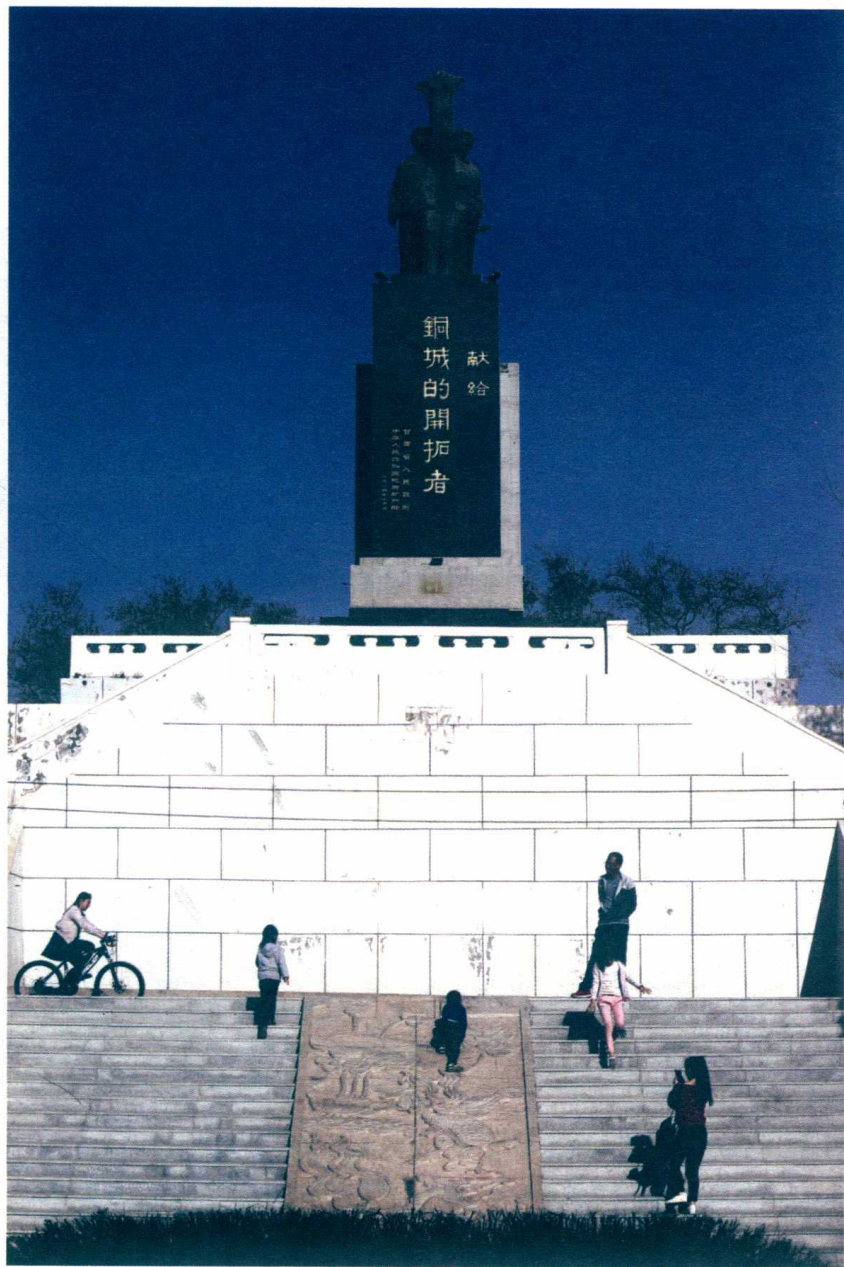
白银市标志性建筑——“献给铜城的开拓者”雕像