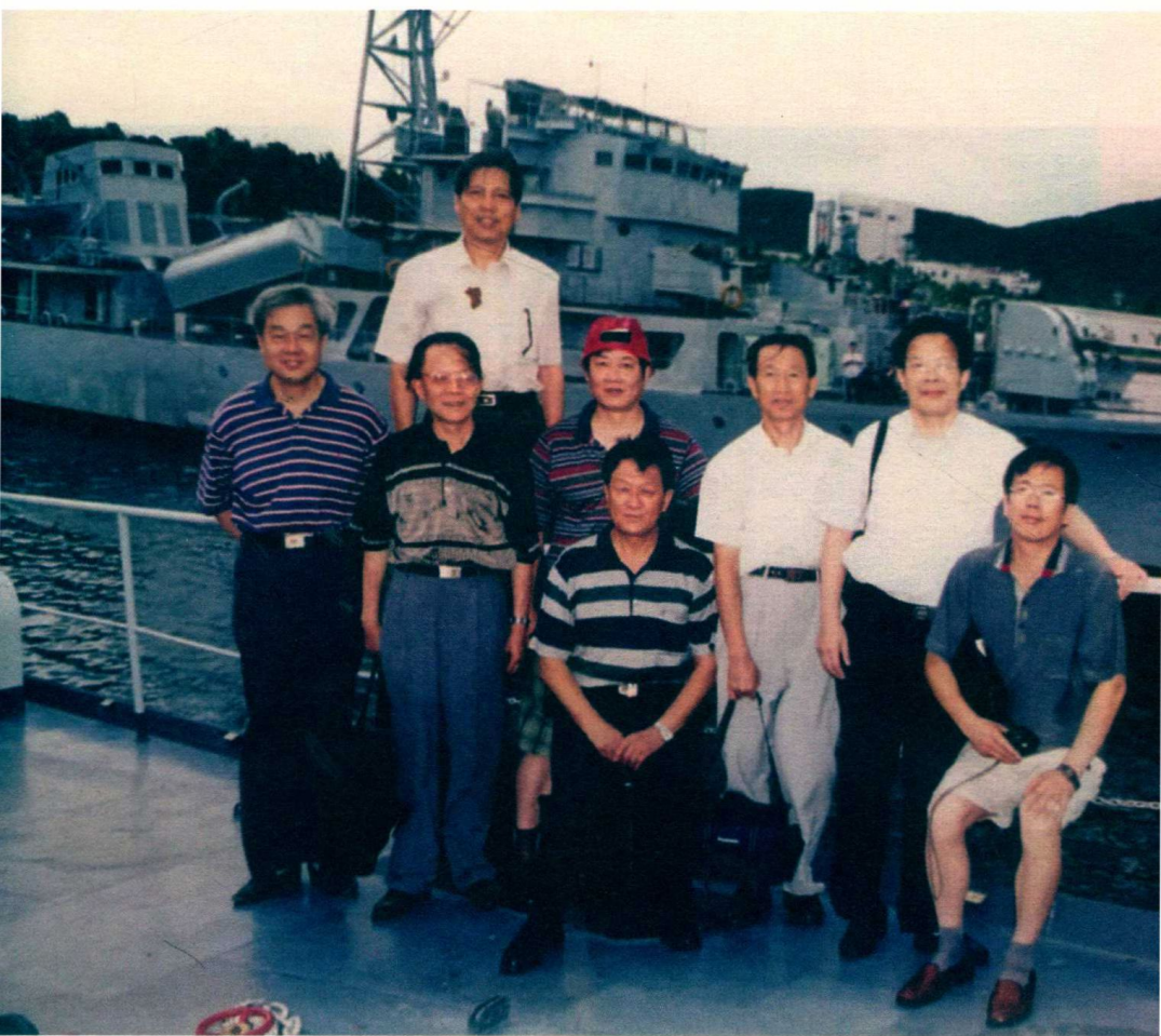
1999年，公安部首批八大刑侦专家合影（从左到右，第一排：乌国庆、徐利民；第二排：高光斗、吕登中、张欣、崔道植、季宗棠；第三排：陈世贤）