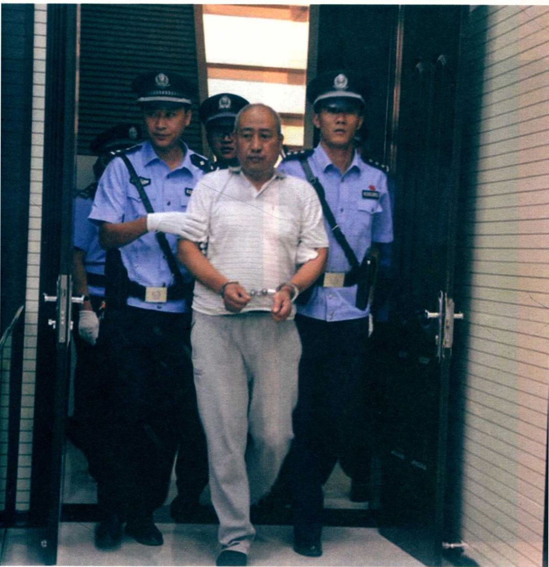
2017年7月18日上午9时，甘肃省白银市白银区人民法院，白银案初审开庭，高承勇被法警带入法庭