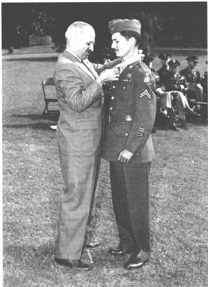
★ 美利坚合众国总统杜鲁门将陆军荣誉勋章授予戴斯蒙德·道斯