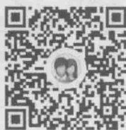
读者服务 QQ 群