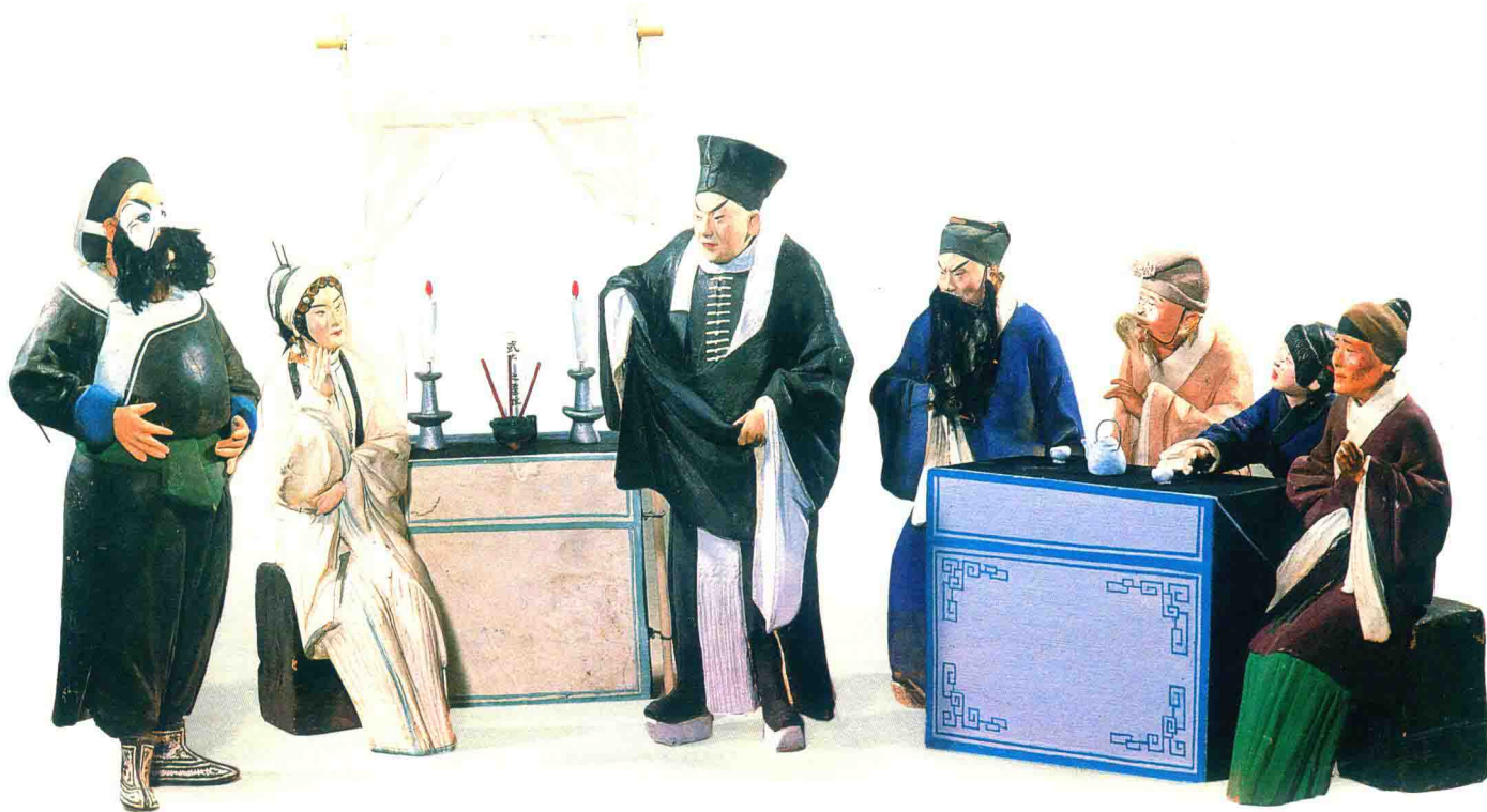
武松省亲(张玉亭) © “泥人张”彩塑

总之，无论是原始淳厚质朴的彩陶器物，粗犷古拙的男女奴隶俑，已形成飘逸超然之风的魏晋南北朝