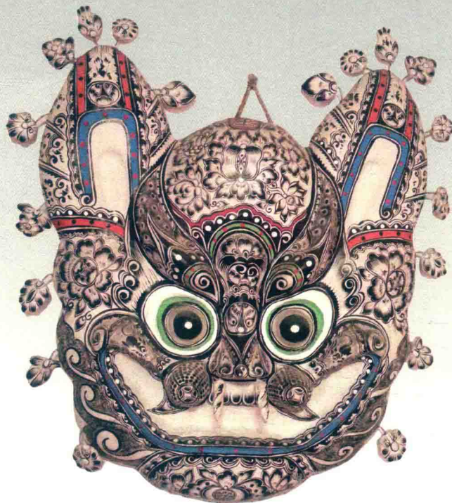
挂虎（胡深）◎凤翔泥彩塑

中国民间泥彩塑植根于中华文化沃土之中，它循系中华文化的优秀文脉，生发繁衍，逐渐形成数量众多、规模宏大、风格迥异的艺术形式。它是世世代代人民群众精神力量的体现，是高度智慧与卓越创作才能的结晶。