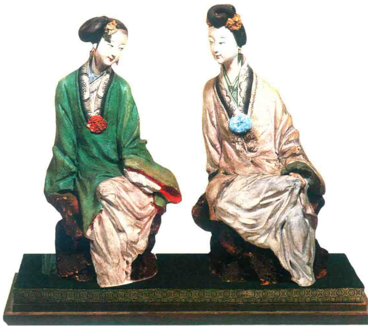
少女(张明山) © “泥人张”彩塑

泥彩塑的滥觞可以追溯到五六千年前的新石器时代，原始的先民在自己的劳动中逐渐将单一的物象复合化，显示了类型化的美，并把不同形象的物品经过加工琢磨变成相同的形象，显示同一性的美，于是他们对物象审美意识与意趣的思维闪光，影响并促成了中国民间泥彩塑艺术的形成。后来，秦汉以前作为“明器”使用的彩俑出现，使这种将古拙质朴的造型与彩绘结合的技巧成为了隋唐以后彩塑发展的基础。而隋唐彩塑又在新的外来艺术滋养中产生了新的变化，从朴素到精炼，从质朴到丰富，但又不失以前追求神韵的特点，同时在其艺术实践中又不断地提高和完善了造型与彩绘结合的技巧。