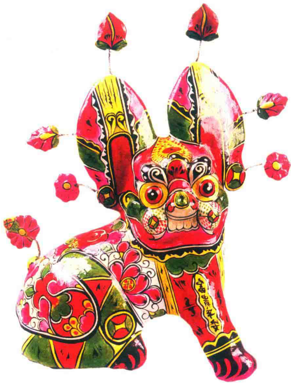
镇宅卧虎（胡永兴）◎凤翔泥彩塑

正是由于中国民间泥彩塑生发于华夏民族的文化土壤的根性，于是在其渐进变化中，它的创作理念、创作方法、工艺程序、审美标准和风格形态，都与中国传统文化一脉相承，也与其渐进中的历史环境息息相关。中国民间泥彩塑在各历史时期受当时社会政治、经济文化等诸多因素的影响，形成不同时期的艺术形式的差异性，这种差异性构成了各个时期民间泥彩塑艺术成因的地域性和风格的多样性，从而留下了中国民间泥彩塑有规律性的历史发展轨迹。这正如美国著名人类学家路易斯·亨利·摩尔根指出的：“我们感到幸运的是，人类进步的事件不依靠特殊的人物而能体现于有形的记录中，这种记录