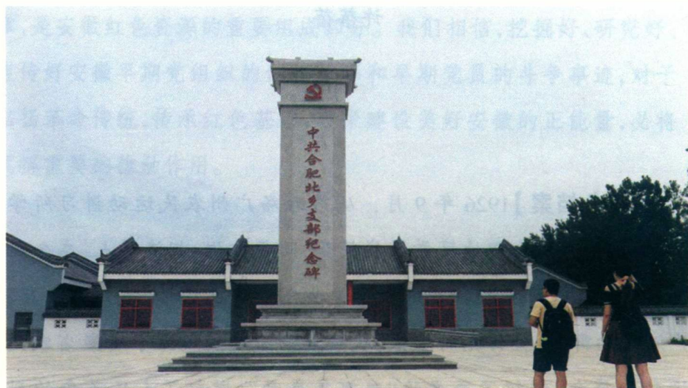
中共合肥北乡支部纪念馆门前广场