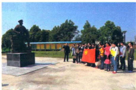
七一期间,干部群众举行纪念崔筱斋烈士活动

纪念馆主体结构为灰黑色,与其形成鲜明对比的是鲜红色的门窗和立柱,经过雨水的冲刷显得格外醒目。开阔的纪念馆广场上,一座中共合肥北乡支部纪念碑高高耸立。纪念碑顶部,一枚红艳艳的党徽熠熠生辉。