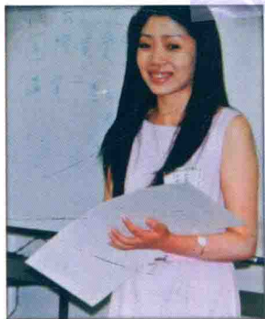
在京都大学获得论文国际奖，在颁奖仪式上领取奖状和奖金。