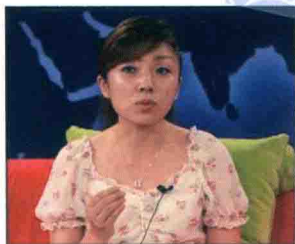
受邀参加腾讯特别访谈，做日语能力考试相关的讲座。