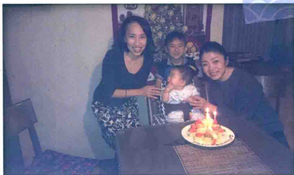
京都的挚友为我庆祝生日，多年的友人，共同的心理学者研究者。