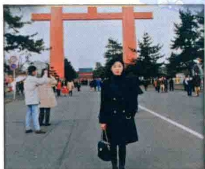
新学年伊始，来到京都平安神宫许愿。希望在新的一年里多看、多听、多学、多记、多思考。