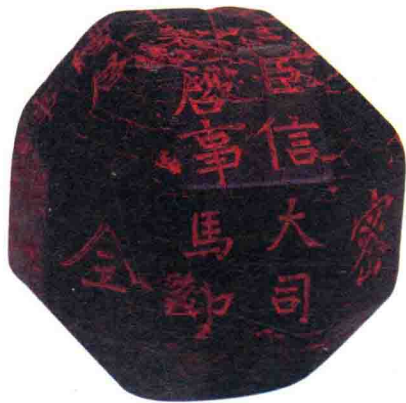
• 独孤信多面体煤精组印·西魏 •