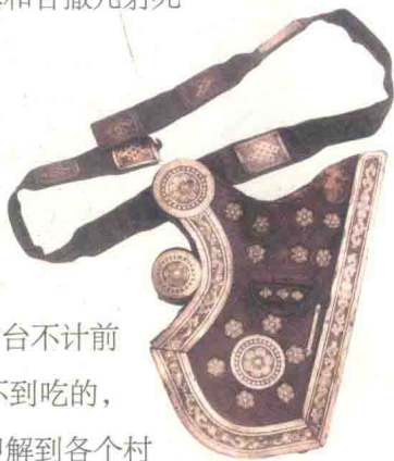
● 蒙古骑兵使用的箭袋 ●

铁木真脱险逃回了家，此时母亲与弟弟妹妹都已不在原住处了，他找了很久，终于在斡难河一条支流的小山里找到了他们。为了防备再遭袭击，他把全家迁到古连勒古山下。